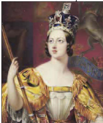
L-inkurunazzjoni tar-Regina Vittorja fl-1837 impittra minn George Hayter (1792-1871)