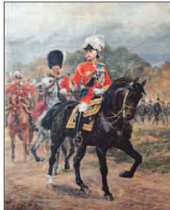
Id-Duka ta' Connaught (1850-1942)