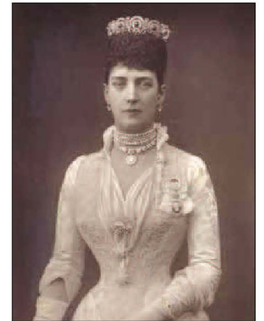
Ir-Regina Alessandra (1844-1925)

1861), prim kuġin tagħha, li miet qasir il-ghomor. Minn daż-żwieġ huma kellhom disat itfal, bir-Re Dwardu VII (1841-1910) jilhaq minflok ommu. Bl-