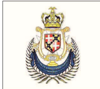
L-emblema tal-Banda Karkariża 'Duke of Connaught's Own'

L-uniformi u isemha nbieghu lill-banda Żurriqija. Dan kollu ġara fl-1908. Fil-każin tal-banda Karmelitana Żurriqija wiehed jilmah bandalora artistika bix-xbieha tar-Regina Vittorja fuq sfond ikhal li nqas fl-1951 fl-okkażjoni tas-seba' ċentinarju tal-Karmnu u għeluq il-150 sena mit-twaqqif tal-fratellanza fil-parroċċa taż-Żurrieq. Il-bandalora, iddisinjata minn mastru