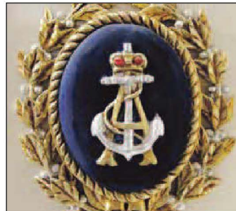
L-emblema tas-Socjetà Maltija San Lawrence