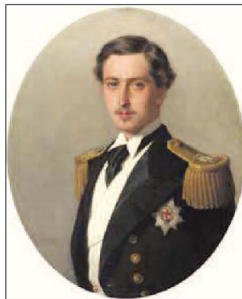
Il-Prinċep Alfred – Duka ta' Edinburgu

Żgur li għall-Inġliżi tal-klassi għolja din kienet l-era tad-deheb u baqgħet magħrufa bhala dik Edwardjana. Bhala mexxej l-aktar popolari, 'Bertie' – kif kien komunement magħruf – irnexxielu jsahhah lil pajjiżu qabel l-Ewwel Gwerra Dinjija.