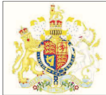
L-emblema tal-Banda Beltija King's Own