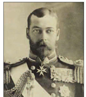
Ir- Re Ġorg V (1865- 1936)

binha Edward], il-M.T. r-Re Dwardu VII, id-Duka ta' York sar Prince of Wales, werriet tat-tron. Il-banda Duke