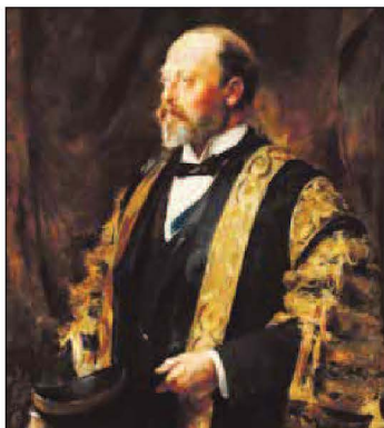
Ir-Re Dwardu VII (1841-1910)