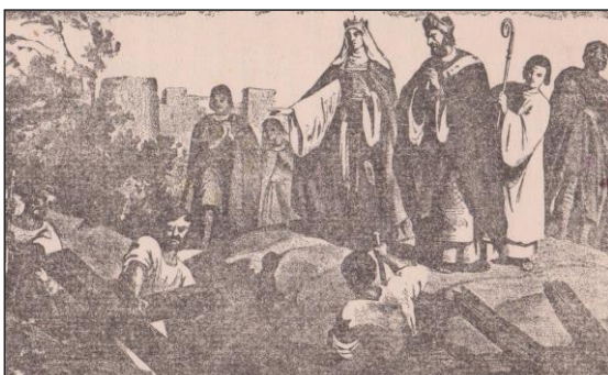
Santa Liena ssib is-Salib Imqaddes (Storja Sagra Vol. IV, p. 156 ta' Annibale Preca [1948])

Profil: Sant'Elena twieldet c.250 w.K. fl-Asja Minuri. Waqt li l-Imperatur Kostanzu Kloru kien qed jikkumbatti fil-Brittanja (Ingilterra), issaħħar wara ġmielha u ħadha miegħu Ruma fejn iżżewġu u kellhom tifel, Kostantinu (c.280–337 w.K.). 15 Aktar tard, binha wkoll laħaq Imperatur tal-Imperu Ruman fil-Punent fis-sena 312 w.K., u kien hu stess li pproklama 'l-ommu Imperatriċi.