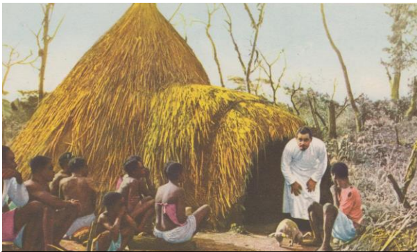
Wahda mill-ħafna kartolini li kienu joħorġu b'riżq l-Opri Missjunarji Pontifiċi mahruġa mill-Uffiċċju Missjunarju