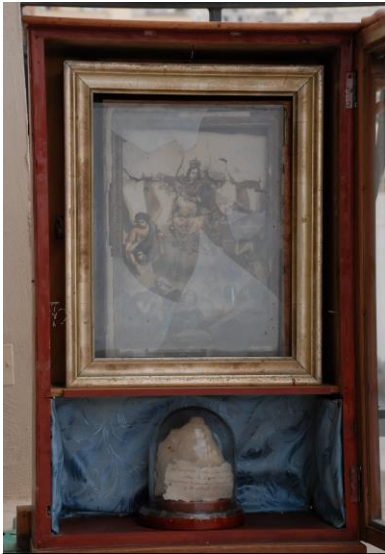
L-inkwatu tal-Madonna u l-ġebła jinsabu fil-knisja parrokkjali tal-Gżira