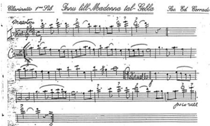
Partitura tal-Innu lill-Madonna tal-Ġebła, mużika ta' Dun Dward Corrado

F'dawk li huma versi, fl-artiklu tiegħu 'Innu ta' Naxxari ġdid Mużikat', datat it-12 ta' Lulju 1951, insiru nafu li Dun Anton għamel użu mill-vers dekasillabu minħabba l-mużika. Fil-każ tar-ritornell, il-poeta ħaddem il-vers ottonarju, kif normalment insibu fil-kwartini tal-għana popolari. Dun Anton ma naqasx ukoll li fl-artiklu jikkwota r-ritornell peress li l-qofol tal-ġrajja kollha jinsab f'dal-erbat ivrus: Jekk barrani kasbar ġieħek; / Meta ġebła tefa' għalik; / Aħna biss vleġeg ta' mħabba, / Għandna jtiru għal ġo fik.