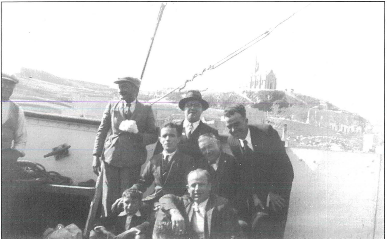
Ritratt ta' dawk li habirku kemm felhu biex il-qanpiena l-Għadixija tiġi f'pajjiżna. Fuq il-luzzu, hekk kif il-qanpiena tghabbiet fl-Imġarr Ghawdex, lesta biex tinġieb f'Hal Tarxien