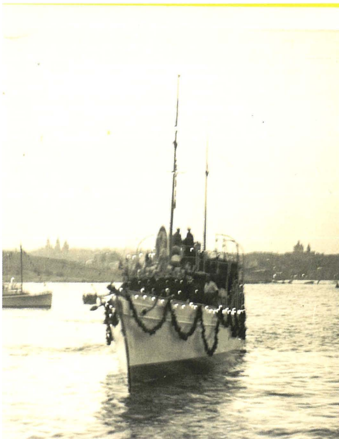
L-istatwa tal-Madonna ta' Fatima Tasal F'Tas-Sliema