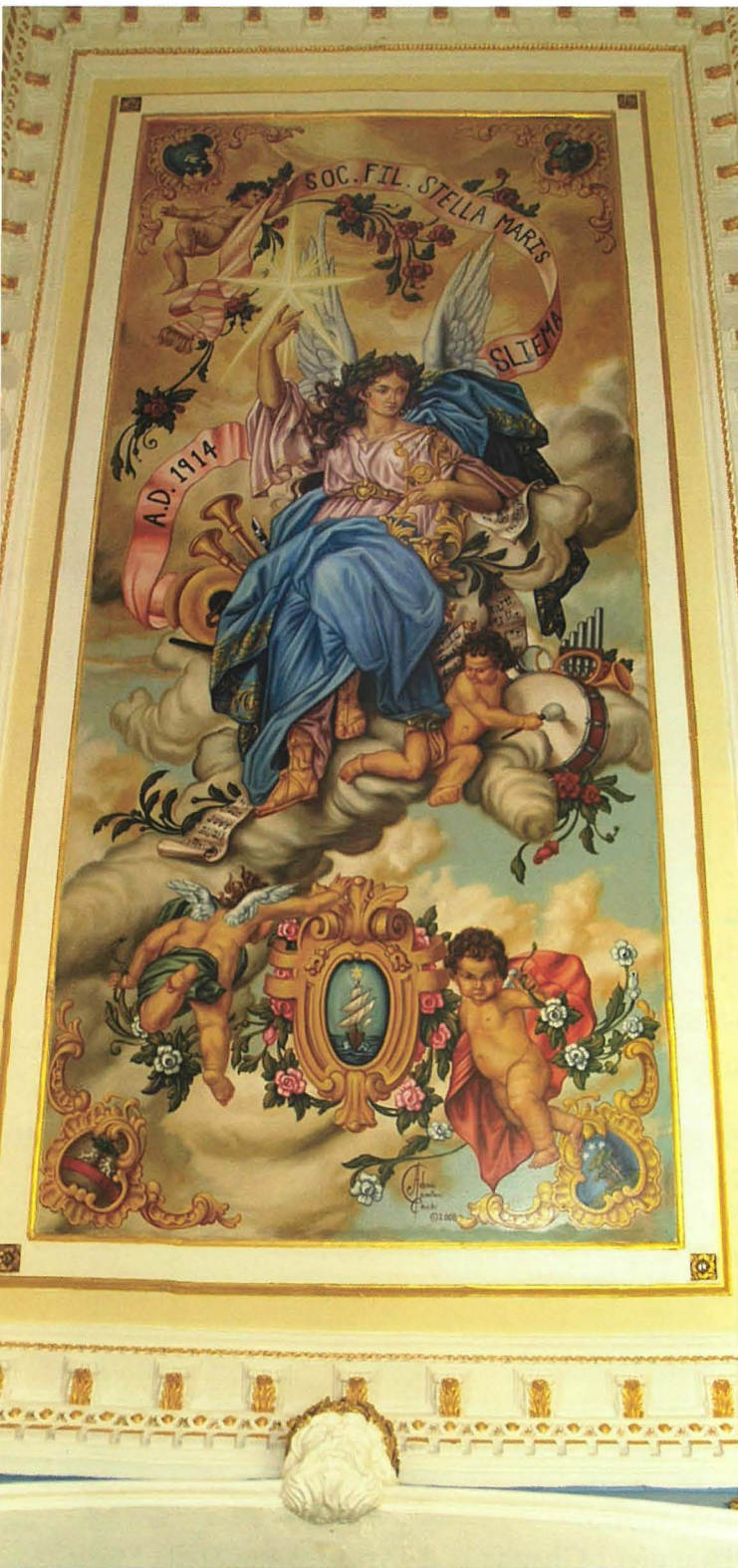
Il-Pittura l-Ġdida inaugurata fl-2008

Din l-Għaqda sa' mit-twaqqif tagħha kienet awtonoma kemm mill-Knisja Parrokkjali kif ukoll mis-Soc. Fil. Stella Maris.