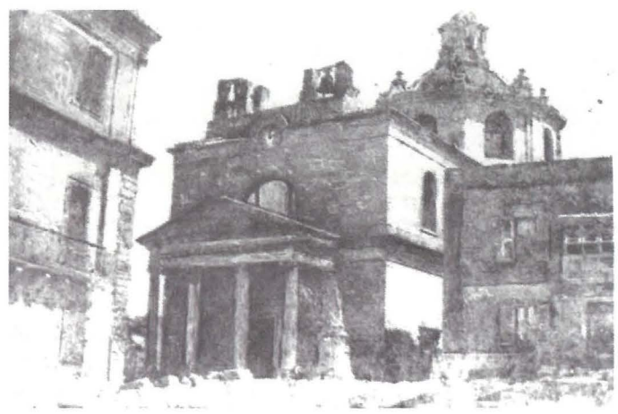
Il-Knisja ta' Stella Maris kif kienet tidher fl-1878 meta saret L-Ewwel Parroċċa ta' Tas-Sliema

Fil-okkazjoni tat-twaqqif tal-Parroċċa tal-Madonna tas-Sacro Cuor, Il-Banda Stella Maris għamlet żewġ Programmi mużikali wieħed filgħodu u l-iehor filgħaxija nhar it-22 ta' Settembru, bl-għan li jingabru fondi b'risq il-Parroċċa l-ġdida.