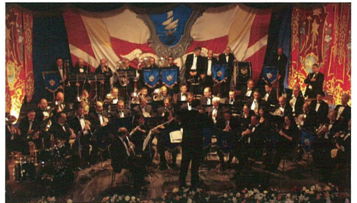
Il-Banda Stella Maris fil-Music Fest 2007