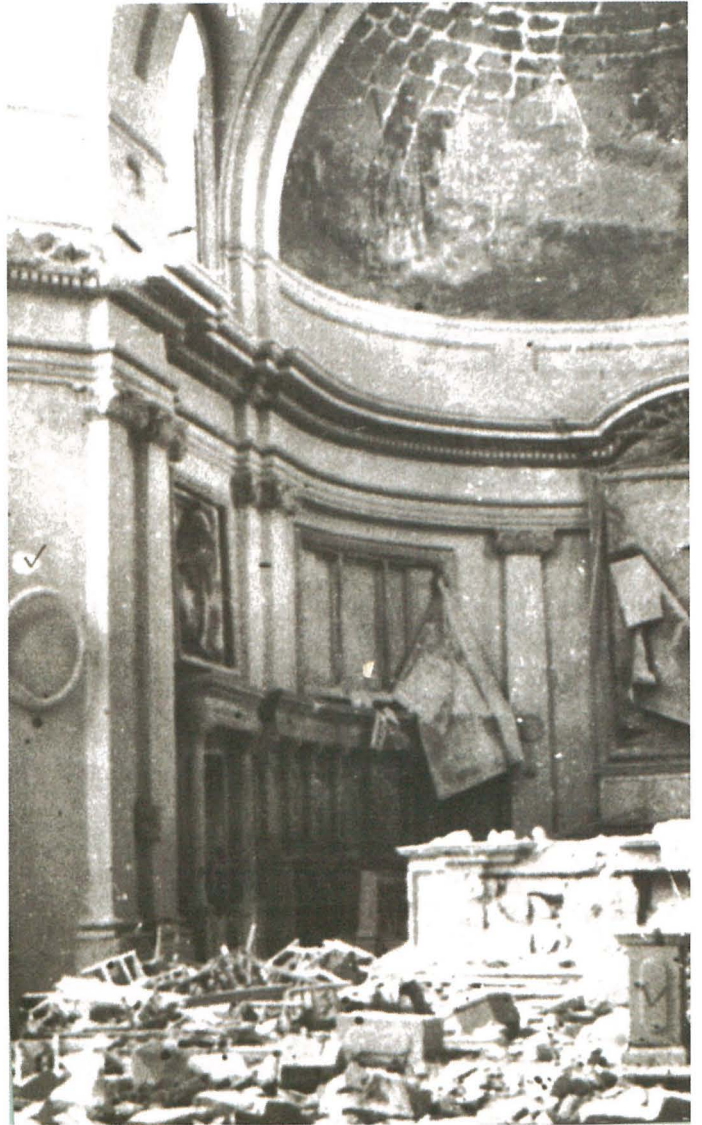
Il-Knisja wara li ġiet milquta