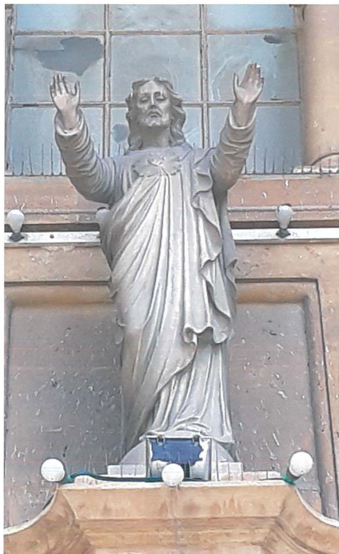
Statwa tal-Qalb ta' Ġesu mal-Faċċata tal-Knisja