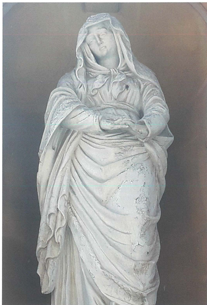
Statwa ta' Marija Addolorata mal-Faċċata tal-Knisja

biċċa art oħra tmiss ma' l-istess knisja. Beda jsir il-ġbir sabiex jintlaħaq l-għan aħħari, jiġifieri dak li titkabbar il-knisja. Barra minn hekk, il-Kapitlu tal-Katidral ta s-somma ta' mitejn u hamsin lira sterlina filwaqt li diversi benefatturi kkontribwew bejniethom mitejn lira oħra. Sa Dicembru 1877