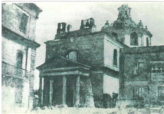
Il-Faċċata l-antiku tal-Knisja ta' Stella Maris

Il-knisja ta' Stella Maris giet miftuħa għall-kult u mbierka solennement nhar il-11 ta' Awissu 1855. Madankollu, minn dakinhar sal-bidu tas-seklu għoxrin seħħ żvillup interessanti f'dik li hi struttura biex allura il-knisja ħadet l-għamla li nafuha ilum.