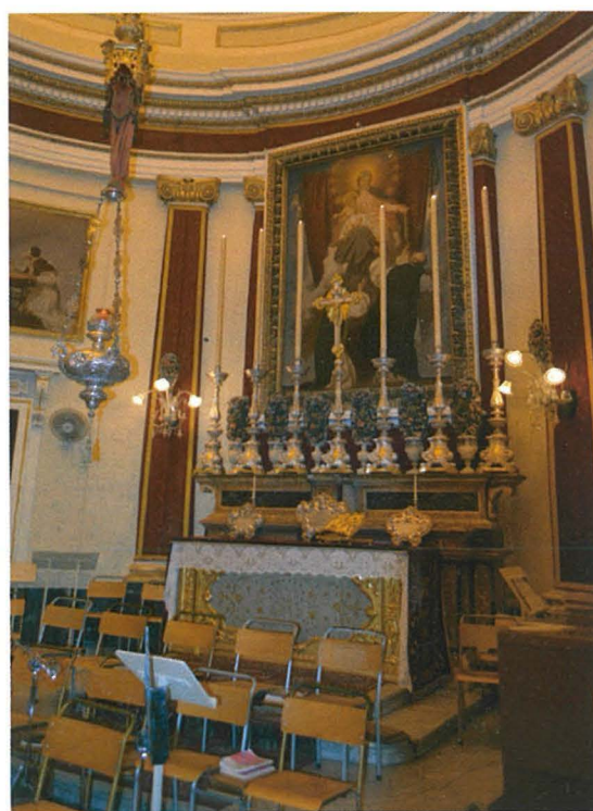
L-artal tar-Rużarju armat fil-Festa Titulari ta' Stella Maris 2012

Naturalment anke f'pajjiżna din id-devozzjoni Marjana wkoll sabet art għammiela. Bdejna naraw artali taħt dan it-titlu tant sabiħ b'uħud