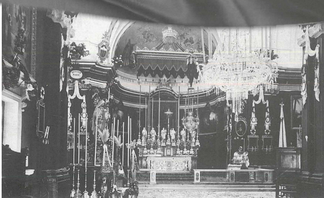
Il-Knisja Parrokkjali armata bil-Kbir f'Ottubru ta' l-1922, fl-okkażjoni tal-25 sena tal-Fratellanza tar-Rużarju

żewġ artali. F'dak tal-lemin ta' l-altar magġur hemm l-artal tal-Krucifissjoni ta' Sidna Ġesu Kristu u allura l-kappellun beda jissejjaħ tad-Duluri minhabba l-fatt li bdiet tieġu ħsieb dan l-artal il-Pija Unioni li wara saret it-Terz Ordni Tas-Servi ta' Marija.