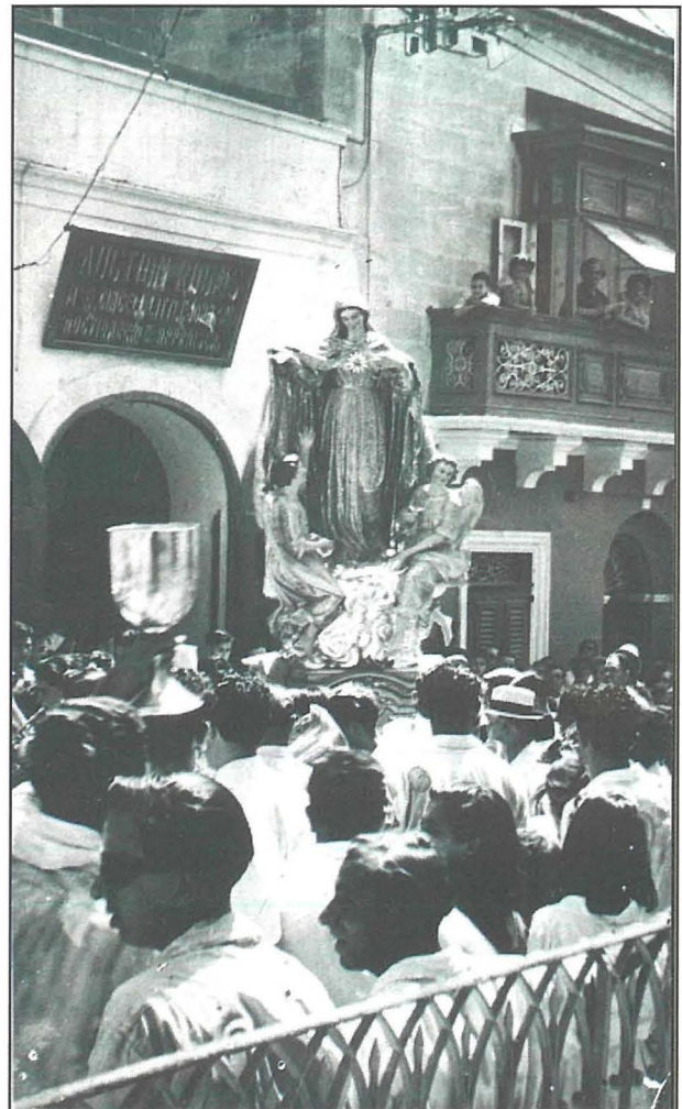
L-istatwa ta' Stella Maris tingieb lura wara l-gwerra

Bil-mod il-mod huma ftit dawk li għadhom huma ftit dawk li għadhom magħna u li għexu dawk iż-żminijiet imwiegħra. Dmirna jibqa' li nuru rikonoxximent lejhom u filwaqt li fit-talb tagħna niftakru f'dawk li telqu għal Hajja Eterna nibqgħu ngħożžu hdimthom fil-ġlieda għall-libera' u ż-żelu tagħhom sabiex isalvaw dak li setgħu mill-qerda ta' l-għadu.