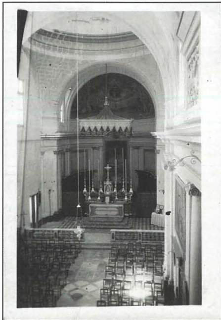
Ħajt divisorju jidher jifred il-knisja Mill-kappellun tad-Duluri