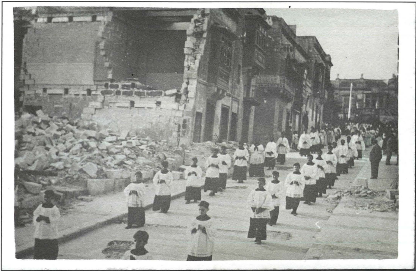
Il-purċissjoni ta' Stella Maris f'Awissu 1942 nizla Triq San Vincenz qalb it-tifrik.