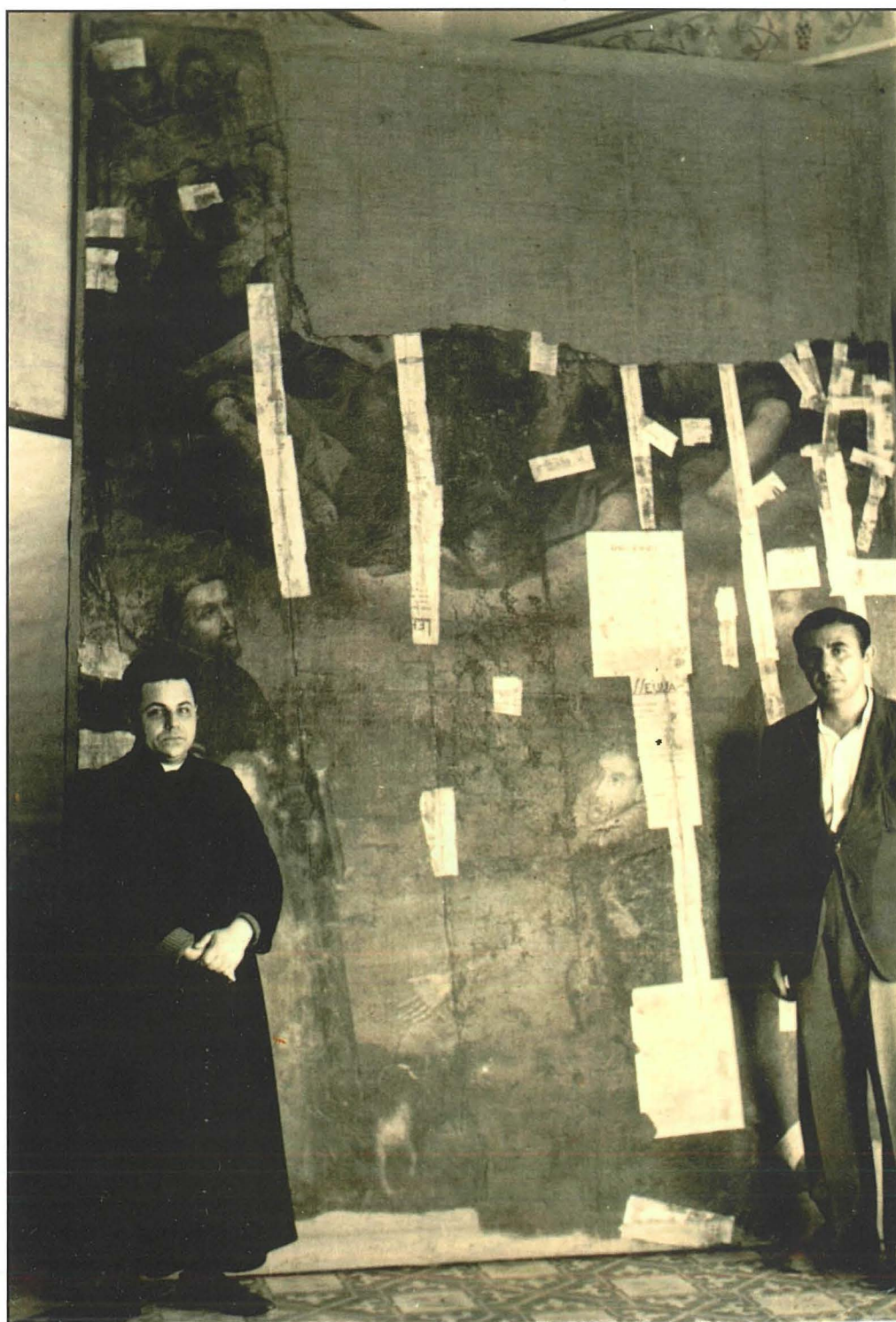
Il-kappillan Inguanez u fl-isfond l-Kwadru Titulari qed jiġi restawrat.