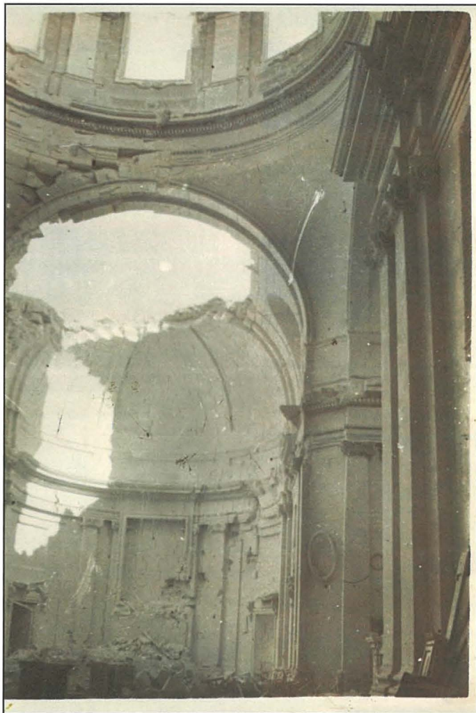
Il-ħsarat li soffriet il-Knisja nhar l-1 ta' Marzu 1942

Fl-14 ta' Mejju ta' l-istess sena, bombi ta' l-għadu għamlu ħerba sħiħa fi Pjazza Annunzjata u mietu seba' minnies. Irridu ngħidu hawn li f'dawk iż-żminijiet imwiegħra s-sede tal-Filarmonika Stella Maris qdiet funzjoni soċjali