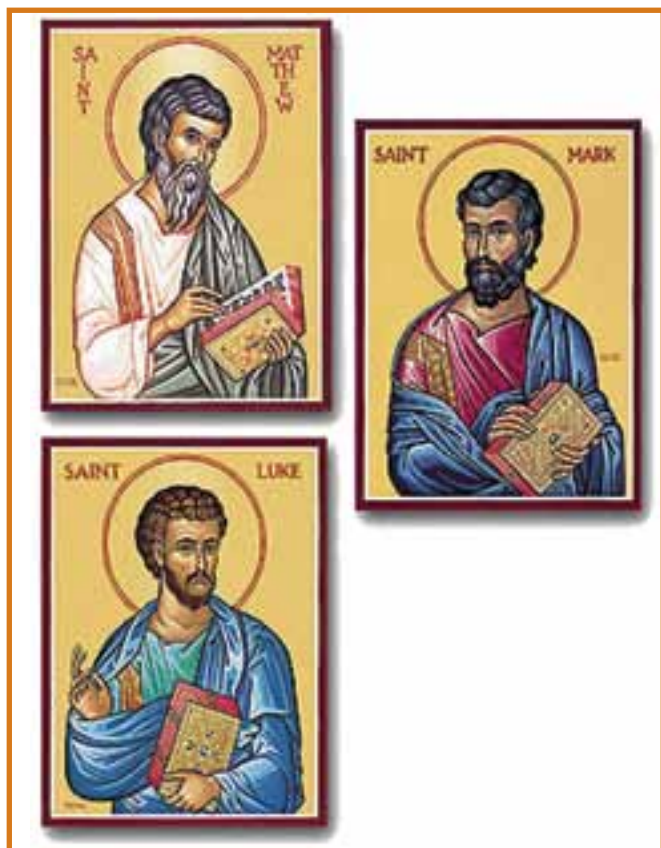
Is-Sinottiċi (Mattew, Marku u Luqa)

il-Ġdid. It-Testment il-Qadim jtkellem direttament fuq id-divinità, jew fuq Alla b'mod generali li fil-Patt il-Qadim kien jitqies bħala l-Missier ta' Izrael b'relazzjoni għas-salvazzjoni tal-bniedem. Din ir-relazzjoni tiġi ċċarata fil-wegħdiet li hu għamel lill-istess poplu u mill-obbedjenza li talab minnu. Dan il-Missier ta' Izrael juri lilu nnifsu b'mod imdallam f'natura waħda fi tliet persuni ndaqs: Il-Missier bħala principju li jnissel il-Kelma tiegħu (li hu l-Iben), u bejnu u l-Kelma jiġi l-Ispirtu ta' l-imħabba.