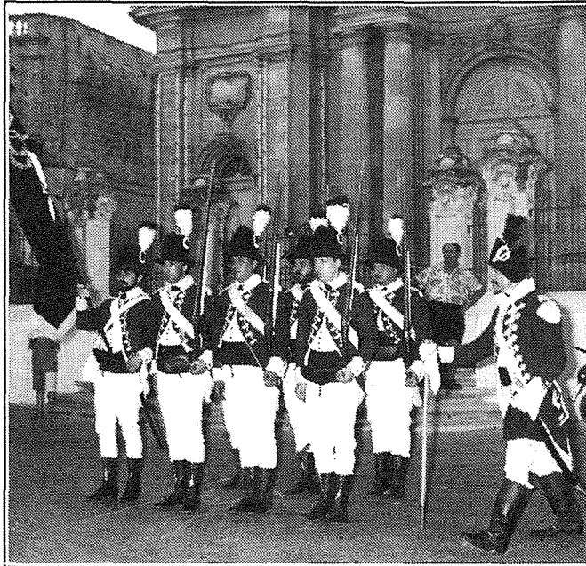
I Cacciatori Maltesi, li nġabu l-Gudja mill-Kunsill Lokali waqt il-kommemorazzjoni tal-200 sena tal-miġja tal-Franċiżi f' Malta. Dawn kienu kaċċaturi mill-kampanja mwaqqfa fi żmien il-Granmastru De Rohan fl-1777. Fi żmien il-Franċiżi kienu ssieħbu fid-difiża ta' pajjiżna kontrihom.

Din is-sena nfakkru l-mitejn sena minn meta l-Franċiżi okkupaw il-Gżejjer Maltin u fl-istess waqt meta missirijietna b'kuraġġ kbir inblukkaw l-istess Franċiżi fil-belt ta' Malta għal sentejn shah. Dan kollu beda jseħħ proprju fl-istaġun tal-festi. Ahna llum meghdijin bil-baned, sparar, ċerimonji u tiżjin. Għalhekk kultant huwa tajjeb li wiehed jieqaf u jahseb f'tit x'ghadda minn missirijietna f'dak is-sajf tal-1798 u kif b'sagrificċji kbar il-Maltin għal sentejn shah kellhom jinsew li ghandhom familja, li ghandhom djarhom, l-ghelieqi bil-prodotti tagħhom u hafna affarijiet ohra, fosthom il-festi tar-rahal, li llum niċċelebraw tant bil-herqa. Dawn li ġejjin huma xi ġrajjet li laqtu dirett lill-poplu Malti, u b'mod partikulari, lin-nies tar-rahal tagħna.