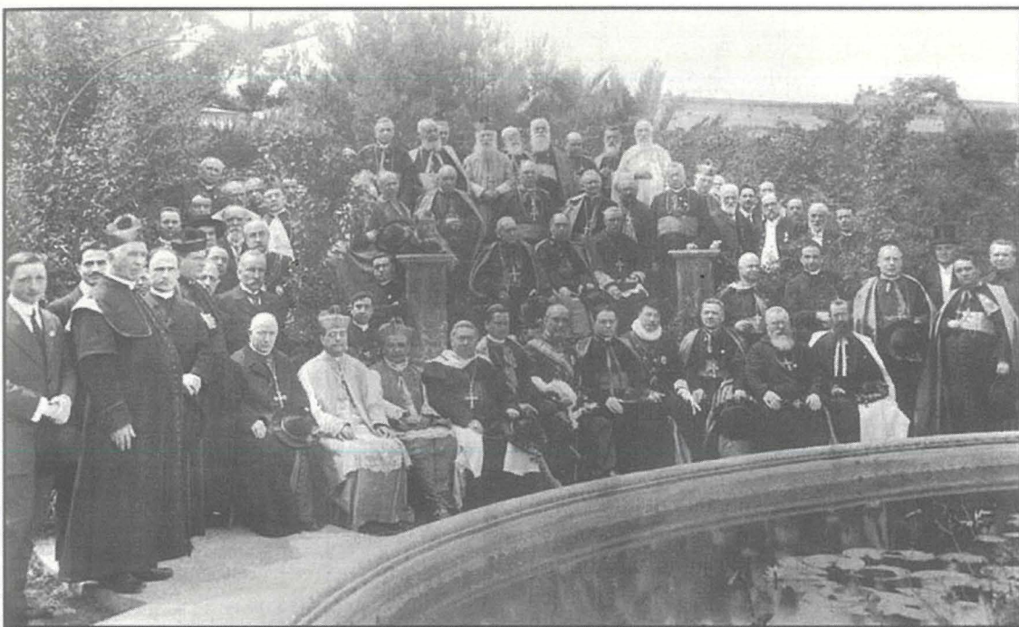
1913 — The 24th International Eucharistic Congress

B ejn it-22 u s-27 t'April 1913 inżamm f'Malta l-Erbgħa-u-Għoxrin Kungress Ewkaristiku Internazzjonali. Nistgħu ngħidu li din il-gżira ċkejna tagħna f'nofs il-Mediterran ħarġet bl-unuri kollha fl-organizzazzjoni ta' dan l-avveniment hekk importanti. Żgur ukoll li ma kienx jagħmel għajb għal dawk li ġew iċcelebrati fis-snin ta' qabel fi bliet kbar Ewropej bħal Lille, Avignon, Liege, Friburgu, Brussell, Ruma, Cologne, Londra u l-bqija.