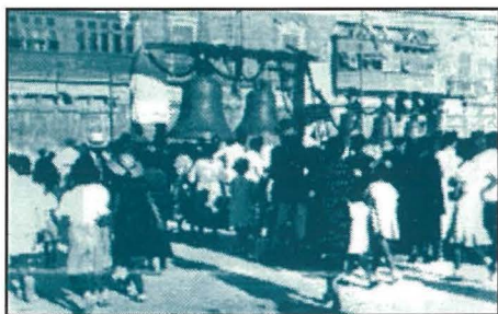
It-tberik tal-qniepen fil-bitħa ta' l-Istitut St. Patrick's.