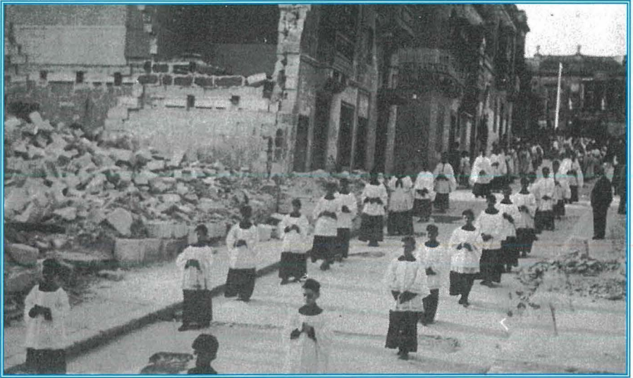
22 ta' Awwissu 1942 – L-unika proċessjoni (minghajr il-vara) li nżammet fis-snin tal-gwerra, għaddeja qalb il-bini mġarraf ta' Triq San Vinċenz.

Stella del Mare' fuq il-kliem ta' Dun Pawl Vella Mangion, l-ewwel qassis li ħareġ mill-parroċċa l-ġdida. Mexxa ż-żewġ baned Slimizi 'I Cavalieri di Malta' u 'Queen Victoria', u fl-1914 waqqaf il-Banda Stella Maris, waħda mill-protagonisti ewlenin tal-festa sal-ġurnata tal-lum.