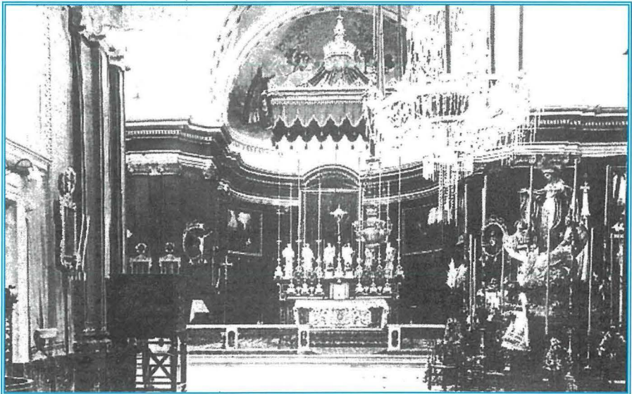
Il-Knisja armata għall-festa 1923.

L-istess gazzetta, minbarra li tat xi dettalji dwar il-funzjonijiet li ġew iċċelebrati fil-Knisja, iddeskriviet l-atmosfera esterna ...vi fu una giostra, ed al calar del sole una brillantissima luminaria accompagnata da un bel fuoco artificiale... Il-gazzetti tas-snin ta' wara baqgħu dejjem isemmu l-festa annwali li kienet bdiet dejjem