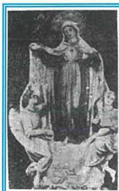
Il-gazzetta 'Il Risorgimento' tas-16.8. 1891 tirrapporta il-wasla tal-Vara minn Franza.

izzid fil-popolarità. Kienu ġew iffirmati kunitati żgħar li bdew jieħdu hsieb jorganizzaw il-festi ta' barra fejn kienu jdoqqu xi baned tas-Servizzi filwaqt li l-mixegħla kienet tkun magħmula minn tazzi kkuluriti mimlija biż-żejt, inkluża l-faċċata l-ġdida tal-Knisja li kienet inbniet bejn l-1906 u l-1909. Il-Festa kienet tiġi ċċelebrata mingħajr il-