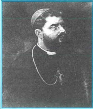
L-Amministratur Appostoliku l-Isqof Antonio Buhagiar. Fl-1886 ta l-permess biex tibda tohroġ il-proċessjoni fil-festa titulari.

Meta nżammet l-ewwel festa ta' Stella Maris fid-19 ta' Awwissu 1855, f'tas-Sliema kienu f'tit inqas minn erba' mitt ruħ dawk li kienu jgħammru fil-ftit toroq ta' madwar il-knisja u n-naħa tal-baħar. Il-gazzetta L'Ordine tal-24 ta' Awwissu kienet l-ewwel waħda li semmiet l-avveniment, fost l-oħrajn li ħafna nies mill-Belt Valletta attendew għal dik l-ewwel festa fir-raħal żgħir ta' tas-Sliema. Kien l-ewwel Hadd wara l-ftuħ tal-Knisja.