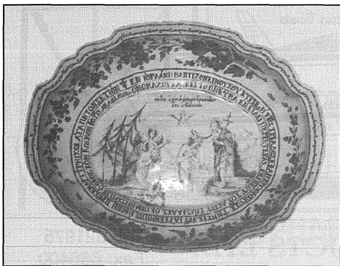
Il-baċil tal-kina li kien jintuża fil-knisja ta' Bir Miftuħ.