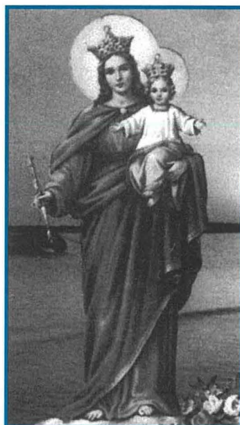
Marija Ghajnuna tal-Insara għand is-Salezjani