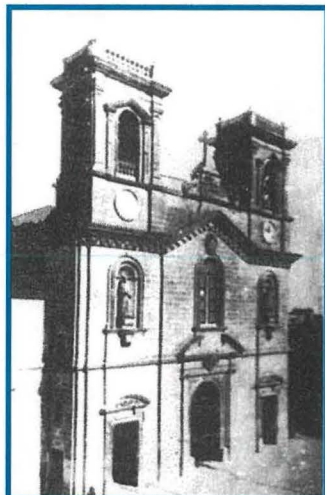
Knjsja tal-Madonna tas-Sacro Cuor – il-façċata l-antika 1881

Minn wara t-tigriġ tal-kappella ta' Tigné fl-1798 sa madwar it-tieni nofs tas-seklu għoxrin f'Tas-Sliema u l-madwar kienu jeżistu erba' knejjes iddedikati lill-Madonna u li bis-saħħa ta' hekk dahlu u tkattru bosta devozzjonijiet Marjani taħt diversi forum u li haġna minnhom għadhom jeżistu sal-lum. Ma tistax ma tissemmiex id-devozzjoni li dahħlu s-Salezjani lejn il- Madonna Ghajnuna tal-Insara mal-wasla tagħhom f'Malta fl-1904, liema devozzjoni għadha qavvwija sal-lum, fejn nhar l-24 ta' kull xahar tinżamm kommemorazzjoni, kif ukoll purċissjoni annwali fix-xahar ta' Mejju.