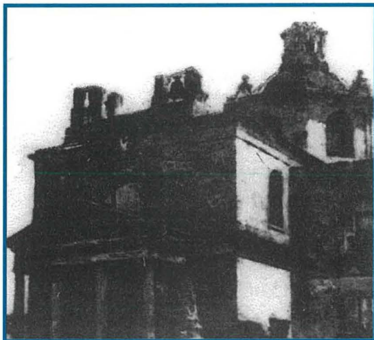
Knjsja ta' Stella Maris – il-façċata l-antika 1878