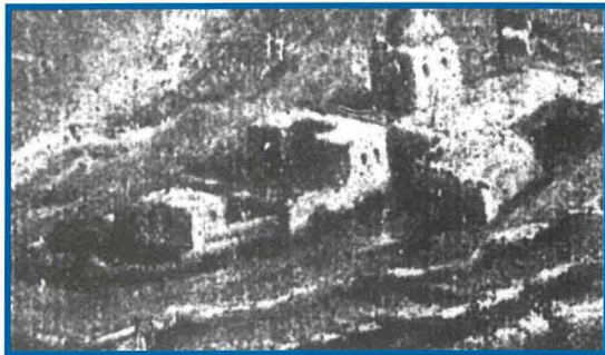
Il-Kappella ta' Tignè – mappa antika tas-seklu tmintax