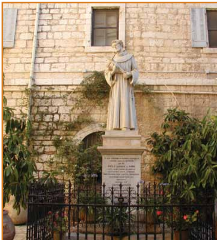
Il-kunvent ta' San Salvatur minn gewwa