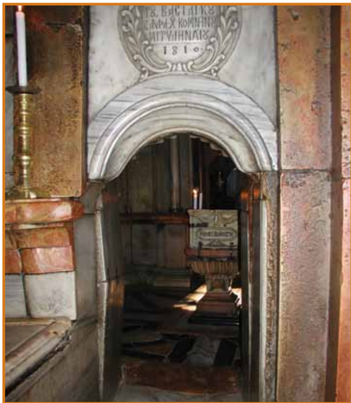
Qabar ta' Kristu

minn Kostantinopli (Istanbul) fuq l-Asja Minuri (Turkija moderna) u l-Ivant nofsani kollu. Huma kienu jimxu bi strategġija li biha kienu jisolhu liss-sudditi ta' l-imperu bl-aktar mod sfacċat. Fil-każ ta' l-Art Imqaddsa t-Torok kienu jafu li l-Insara kienu mifrudin f'diversi Knejjes u riti. Għaldaqstant applikaw il-prinċipju ta' «divide et impera» (ifred u aħkem), prinċipju li sfortunatament baqa' komuni fil-politika ta' kull min iggverna fl-Art Imqaddsa sal-gurnata tallum. It-Torok bdew iqisu lilhom infushom proprjetarji tas-Santwarji tal-Fidwa, hekk li kienu jbigħuhom bl-irkant għal min joffri l-akbar somom ta' flus. B'dan il-mod bdiet kompetizzjoni feroci bejn il-Knejjes, u partikolarment bejn il-Griegi Ortodossi, il-