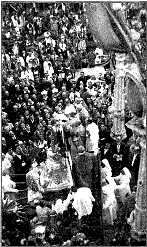
L-Inkurunazzjoni tal-Bambina tal-Isla, 1921

Mal-qlub tagħna ja Bambina, Dil-kuruna ridna ntuk, Biex fuq rasek tibqa' tixhed Kem m tassew aħna nħobbuk!