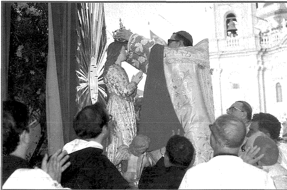
L-Inkurunazzjoni tal-Bambina fix-Xagħra Għawdex, 1973

Madonna tal-Mirakli f'Hal Lija, il-Madonna tal-Għar fir-Rabat, il-Madonna tal-Mellieħa u l-Madonna tal-Grazzja f'Ħaż-Żabbar. Minbarra dawn il-kwadri fil-gzejjer Maltin nsibu wkoll tliet statwi nkurunati solennement li huma Marija Bambina tal-Isla fl-1921, San Ġużep ix-Xiħ tar-Rabat fl-1963 u Marija Bambina fix-Xagħra fl-1973. Ma' dawn l-aħħar xbihat ser tiżdied appuntu l-vara titolari tas-Sacro Cuor ta' Tas-Sliema. L-aħħar inkurunazzjoni solenni li saret f'Malta kienet fl-1975 meta ġiet inkurunata x-xbieha tal-Assunta fil-kwadru titolari tar-Rotunda, il-Mosta, filwaqt li f'Għawdex l-aħħar inkurunazzjoni seħhet fuq ix-xbieha tal-Qalb Imqaddsa ta' Ġesù l-kwadru titolari tal-Fontana tal-1993. Il-ġenerazzjonijiet tal-lum lanqas qatt rajna nkurunazzjoni solenni. Ċerti riti speċjali bħal din kienu jidhru bħala dawk li laħqu saru u daqshekk. Izda l-maħbub Arċisqof Charles J. Scicluna ma ħasibhiex hekk u meta fl-aħħar pussess tal-Kappillan, intwera bix-xewqa li l-vara titolari tas-Sacro Cuor tiġi nkurunata solennement, huwa dlonk qabel li tkun haġa sabiħa u xierqa. U hekk wara li saru t-talbiet u r-rikorsi meħtieġa u ġew approvati, ninsabu biss ftit ġimghat 'il bogħod milli naraw grajja storika u daqstant ieħor ta' devozzjoni sseħħ quddiem għajnejna. F'din il-kitba ser nagħti ħarsa lejn