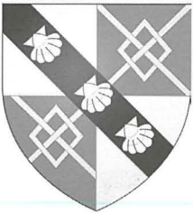
L-ARMA TAL-FAMILJA SPENCER

R o b e r t C a v e n d i s h Spencer twieled nhar l-24 t'Ottubru tal- 1791 fir-Renju Unit. Hu kien it-tielet wild tan- nobbli George