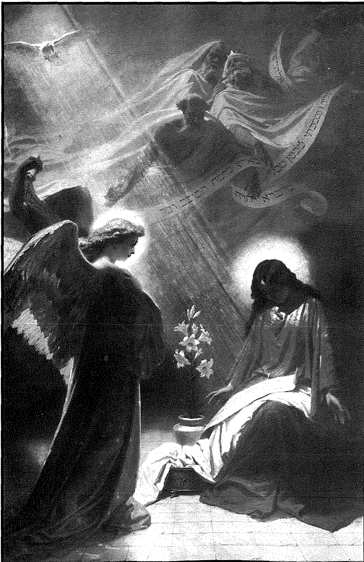
Il-Kwadru ta' l-Annunzjazzjoni ta' Marija fil-Katidral ta' l-Imdina impitter minn Bruschi.

It-trattament ta' l-art fejn qiegħda sseħħ l-azzjoni huwa pjuttost simili fiż-żewġ każijiet. Qabel xejn, angolazzjoni pjuttost għolja ta' l-art hija karatteristika importanti taż-żewġ kwadri. Filwaqt li fit-Thabbira Bruschi jagħżel li jifforma l-art minn ġebel taċ-ċangatura, fil-każ ta' San Ġuzepp, il-personaġġi għandhom tapit kbir tal-qasab,