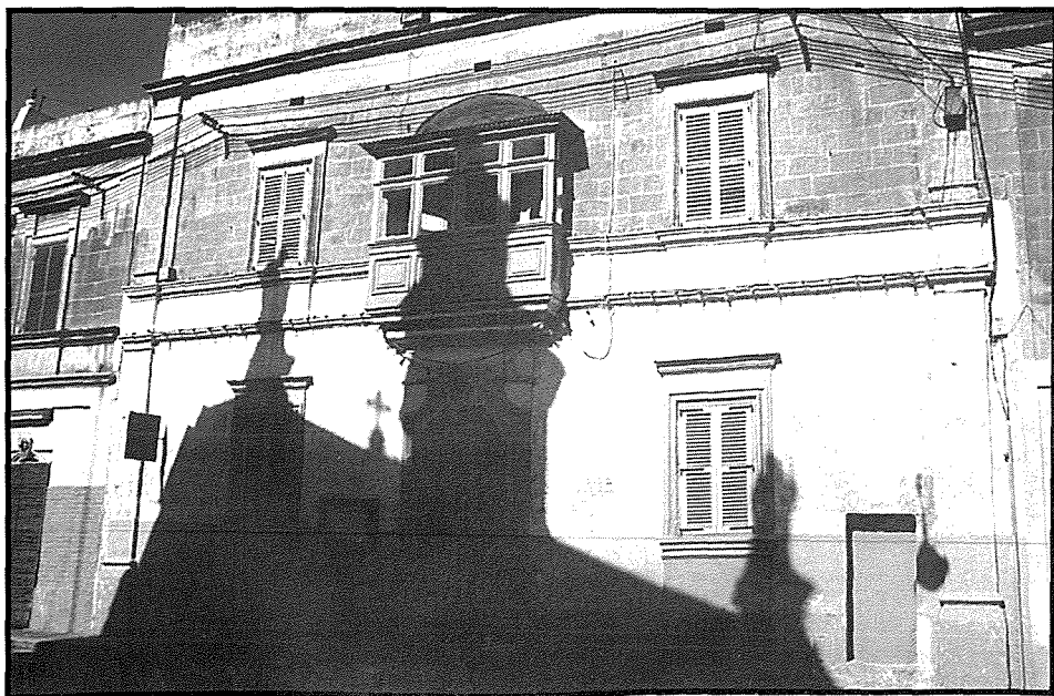
Il-M.U.S.E.U.M. tas-Subien li qabel kien skola tal-Gvern

Hu importanti hafna l-kontribut li tat fil-qasam ta' l-Edukazzjoni l-Knisja f'Malta. Biex qassis jiftah skola kien jehtieg permess minghand l-Isqof ta' Malta. Dan il-Knisja kienet taghmlu, biex tkun certa li f'dawn l-iskejjel jinghata taghlim tassew Nisrani. Il-Knisja kienet ukoll tissorvelja s-suggetti li jigu mghallma u l-post fejn l-applikant ikun se jaghti l-lezzjonijiet tieghu. Il-maggoranza ta' dawn l-iskejjel kienu mmexxija mill-qassisin tal-post. U dan jixhduh il-hafna talbiet li hemm fl-Arkivji tal-Kurja, il-Furjana, fejn il-qassisin jitolbu l-licenzja ta' l-Isqof taghhom biex jifthu skola. Dan il-kontribut tal-kleru qiegħed ukoll jigi rikonoxxut fi zmienna, meta qed naraw li hafna skejjel fil-Gzejjer Maltin qed jissemmew ghal xi qassisin li fl-imghoddi kienu fetħu skejjel fil-parrocċi taghhom. Illum ma nistghux nghidu li dawn l-iskejjel kollha laħqu xi livell gholi ta' l-edukazzjoni, izda kienu jipprovdu taghlim