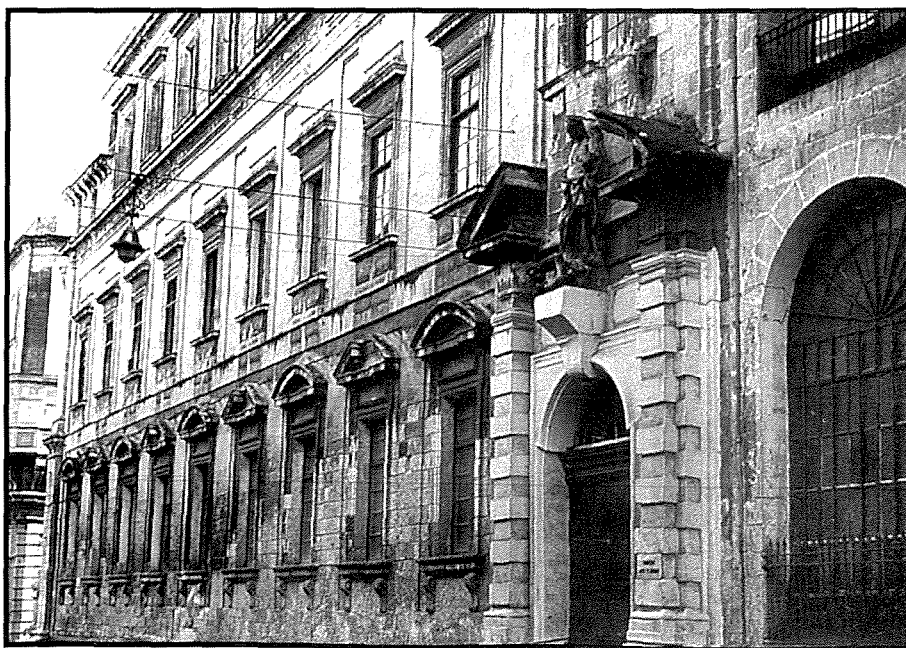
Il-façċata tal-Kulleġġ tal-Ġiżwiti, Belt Valletta, c. 1647

Il-Ġiżwiti fetħu l-ewwel Kulleġġ tagħhom fil-Belt Valletta fl-1602, fejn sa ftit snin ilu kien hemm l-Universita' l-Qadima fi Triq San Pawl. L-Ordni tal-Kavallieri fetħet Skola Medika fl-1673, u s-Seminarju, biex fih jistudjaw il-qassisin, fetaħ fl-1703. Izda l-iskejjel, ukoll