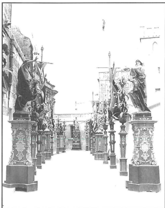
Triq San Ġuzepp fl-1963 wara li twessgħet.

f'vazun sabiħ. Iz-zukklatura u t-tromba bħal tat-trofej l-unika differenza hija fit-tiżjin tat-tromba li hija mzejna b'maskarun li minn ħalqu ħiereg għenqud frott. Imbagħad fuqha hemm pedestall li fuqu tistrieħ il-garra jew qasrija li minnha bħal sigra toħroġ il-pilandra. Dawn il-pilandri huma tal-ħadid u magħmulin minn pjanċi mmartellati, f'forom ta' weraq u fjuri. Kull pilandra fiha tliet saffi ta' fjuri, b'ħames brazzi f'kull saff. Jibdew b'ħames werqiet kbar imbagħad l-ewwel saff bil-brazzi li bejn wieħed u ieħor hu mzejjen bi fjura u hekk jibqgħu telgħin sa fuq dejjem jċkieniu ftit aktar biex il-pilandra tieħu forma piramidali u tispicċa b'brazzi wieħed fil-quċċata. Meta saru dawn il-pilandri fl-1919 kien jixegħlu bl-aċitilena, kull brazz kellu globu mzejjen bl-imsielet tal-ħgieg, dawn kienu jħarsu 'l fuq minħabba l-aċitilena. Kull pilandra