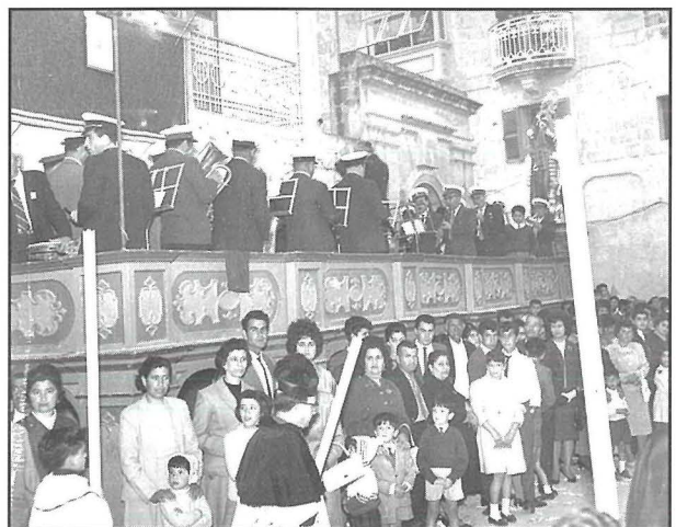
Il-palk tal-Banda li kien jintrama fi Pjazza L'Isle Adam fl-1963.