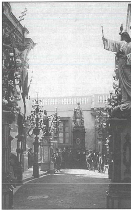
Triq San Ġuzepp bl-armar il-ġdid.