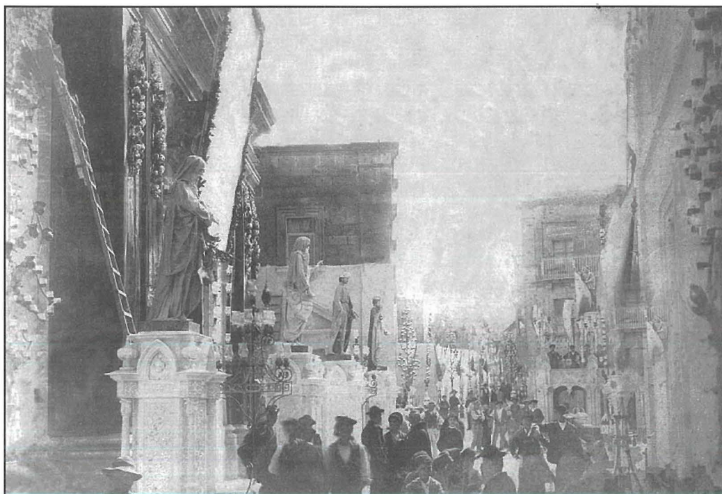
Triq San Pawl armata għall- festa madwar l-1875.