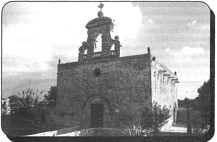
Il-kappella ta' Santa Marija ta' Birmiftuh – l-unika kappella medjevali li baqa' fir-raħal.

tgħodd mal-knejjes rurali. 2 F'dan l-artiklu minie x se nitkellem dwar il-ħames kappelli li kien hemm madwar il-Knisja Parrokkjali l-qadima 3 u lanqas dwar il-knejjes iddedikati lil-Lunzjata. 4 F'dik is-sena l-Gudja kienet raħal ta' tmenin dar, u allura l-proporzjon ta' knejjes għall-popolazzjoni jidher li kien għoli ħafna. Għalkemm wara din id-data l-Gudja kibret sew fil-popolazzjoni, il-kappelli, bil-mod il-mod, bdew jispiċċaw sakemm illum baqa' biss tnejn minnhom weqfin, il-Knisja tal-Lunzjata u