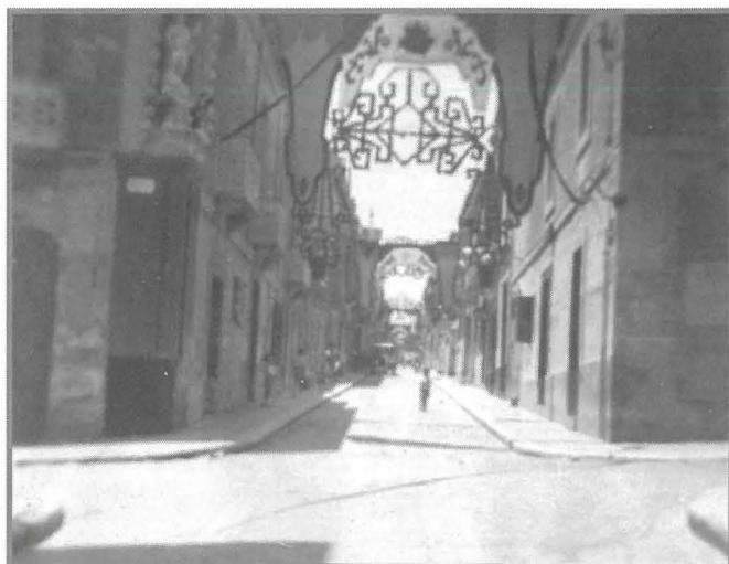
Triq San Trofimu

L-istess gazzetta tkompli tghidilna li banners, flags and bunting being profusely displayed from every top house and establishment . 5