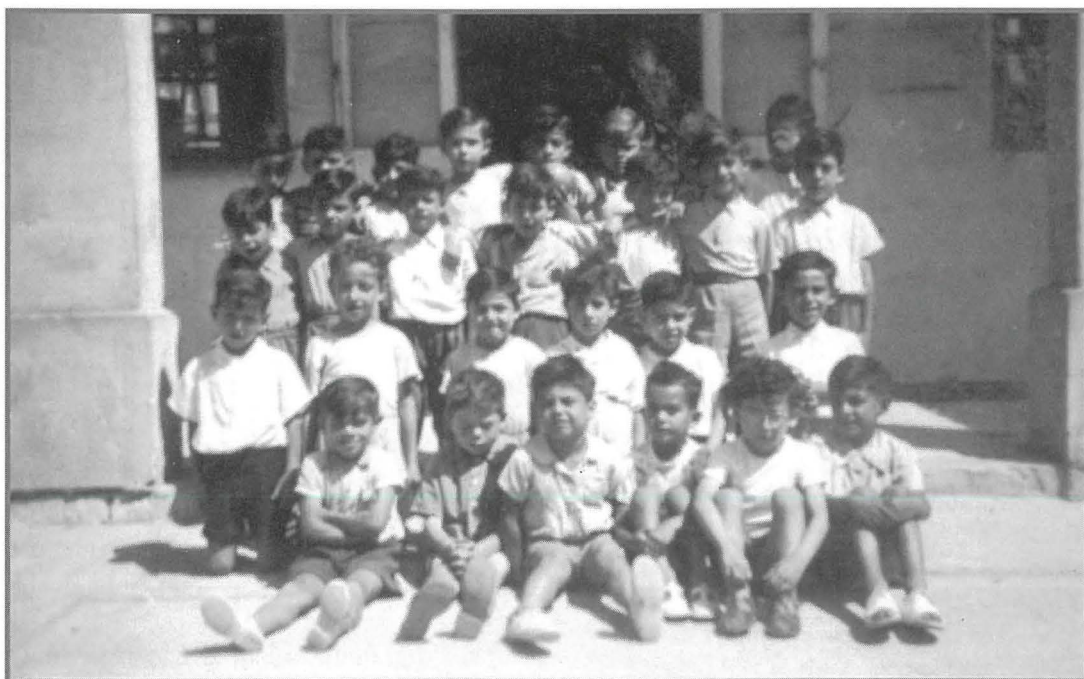
Tfal ta' l-armar 1951.

nefqa ta' £2 15s haxix għat-toroq, intefqu 18-il xelin u 8 soldi biex inxtraw 29 lasta għall-bandieri u 9 xelini u 2 soldi biex inxtraw xi ħbula għall-bandieri. 13