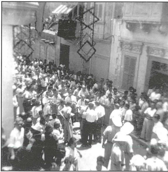
Triq San Trofim

huwa ftit tassew fis-snin ta' wara, nafu bis-sehem tal-Banda Sliema. 24 Fl-1951 minbarra l-Banda Sliema hadu sehem erba' baned barranin li kienu La Valette, San Ġorġ ta' Birkirkara u San Ġużepp 25 filwaqt li fl-1960, minbarra l-Banda Sliema, hadu sehem il-Baned La Vittoria Mellieha u La Valette. 26