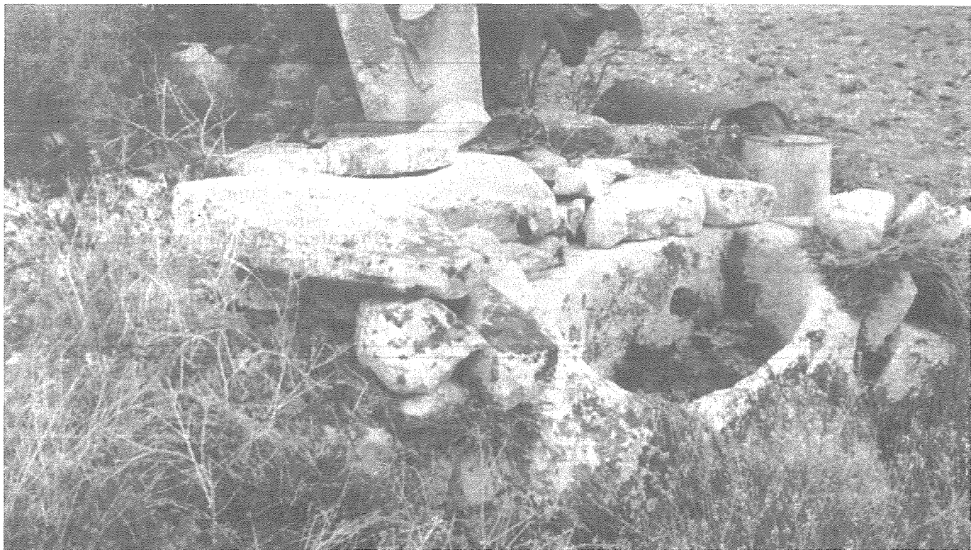
Birmiftuħ: Ġebel kbir fuq Ċisterna

Hawn wieħed irid imur lura fiż-żmien u jgħib quddiem għajnejh veduta panoramika ta' dawn in-naħat fejn tinsab il-knisja ta' Birmiftuħ illum. Kien għadu jirrenja ambjent naturali u sabiħ għall-aħħar b'xi nixxieghat jagħtu hajja lill-ħdura tal-kampanja u l-widien tal-madwar.