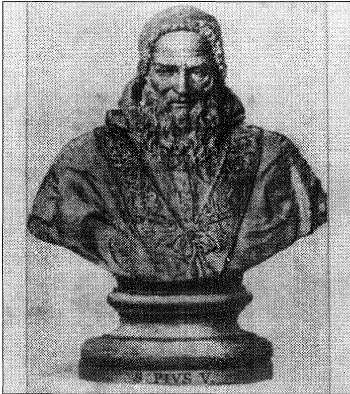
l-bust tal-Papa San Piju V.

Sar isqof ta' Mondovi fil-Piemonte. Billi kien hemm relazzjoni hażina bejnu u bejn il-Papa sab li l-appartament li kellu f'Ruma ttehed u l-