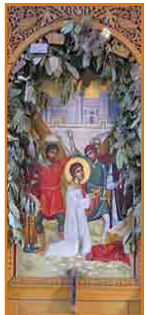
Ikona ta' San Stiefnu

Nghaddu issa biex nġhidu xi haġa dwar il-postijiet li jħarsu t-tifikira qaddisa tal-protomatri San Stiefnu fl-Art Imqaddsa. Nibdedw bil-post tal-martirju. Hemm żewġ postijiet f'Ġerusalem li huma marbutin mal-martirju tal-protodjaknu Stiefnu. L-eqdem