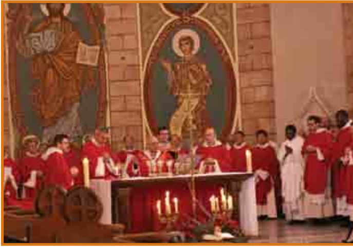
Il-Patrijarka ta' Ġerusalem iqaddes fil-festa ta' San Stiefnu fil-Bażilika tal-Qaddis fl-Ecole Biblique

jibża' (Mh 13,6), għax l-anglu hu xbieha tad-dehra ta' Alla nnifsu. Il-wiċċ ta' Mosè li niżel mill-muntanja bit-twavel tal-Liġi, kien jiddi bil-glorja ta' Alla, u kien inissel biża' fl-Israeliti li ħarsu lejha (Eż 34,29-35; 2Kor 3,17-18). Bl-istess mod il-wiċċ ta' Ġesù ttrasfigurat nissel biża' fl-appostli li kienu miegħu fuq it-Tabor (Mt 17,2; Lq 9,29). Il-membri tas-Sanhedrin bdew jaraw quddiemhom dehra ta' trasfigurazzjoni tal-wiċċ ta' Stiefnu, li kien qiegħed jara l-glorja ta' Alla. Fil-fatt, dan l-aħħar versett tal-kapitlu 6 ta' l-Atti jintrabat mal-versett 55 tal-kapitlu 7, fejn ikompli r-rakkont tal-martirju. Atti 7,1-54 huma diskors twil li jagħmel Stiefnu biex jikkonvinci lis-semmiegħa dwar kif it-Testment il-Qadim wassal għall-verità ta' Kristu li jsir il-veru tempju u l-vera Liġi, li jiehdu post it-tempju u l-Liġi tal-Lhud. Din it-teofanija (dehra ta' Alla) twassal lil Stiefnu biex jidhol f'estasi quddiem l-akkużaturi tiegħu: «Imma hu, mimli bl-Ispirtu s-Santu, u b'għajnejh fis-sema, ra l-glorja ta' Alla u lil Ġesù qiegħed fuq il-lemin