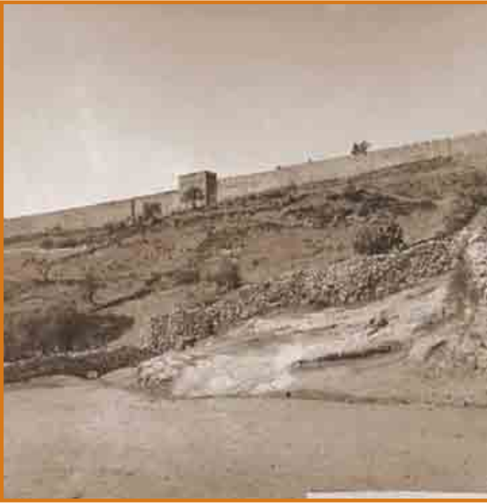
It-taraġ tal-Martirju gabel il-bini tal-Knisja Ortodossa. Jidher il-Bieb tad-Deheb.

tifkira hi dik li torbot il-martirju ta' Stiefnu max-xaqliba tat-tramuntana ta' Ġerusalem, f'it 'il barra minn fejn illum hemm il-Bieb ta' Damasku. Imma għal issa nħallu dan il-post biex nikkoncentraw fuq it-tieni post, dak li jfakkar il-martirju taħt l-ispjanata tat-tempju, fejn illum hemm knisja Griega Ortodossa fuq fdalijiet ta' taraġ imħaffer fil-blat, li kien jinżel mit-tempju lejn il-Wied taċ-Ċedron. Dan il-post intrabat mat-tifkira tal-martirju ta' Stiefnu mis-seklu 12, jiġifieri minn żmien il-Kruċjati, u fil-qrib tiegħu hemm wiehed mill-bibien tal-belt il-qadima ta' Ġerusalem, li jissejjaħ appuntu l-Bieb ta' San Stiefnu.