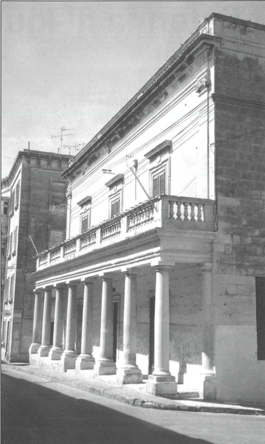
Villa Schinas bil-faċċata sabiha tagħha.

Slimizi b'taġhim nistrani sod. Sabih hafna huwa l-portiku ta' din il-Villa, magħmul minn tmien kolonni ta' stil Doriku. Par Pilastri Joniċi jżejnu l-faċċata tat-tieni pjan ta' din id-dar kbira. Jista' jkun li l-Perit Schinas kellu sehem importanti fit-tifsila tagħha u għalhekk issemmiet għalih. Fuq in-naha l-oħra ta' Villa