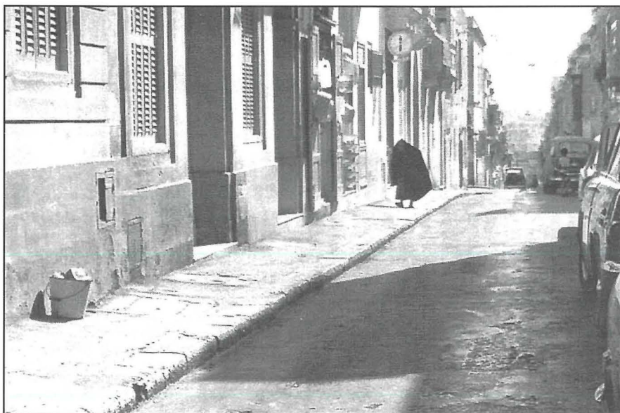
Settembru 1974: It-tallaba fi Triq San Trofimu.

irjus akbar minn tiegħi hallewha barra mill-programm stampat għall-okkażjoni, imma li ġentilment dehret fil-programm tal-festa mahruġ mill-Banda Cittadina “Sliema” ta’ l-istess sena (paġna 83).