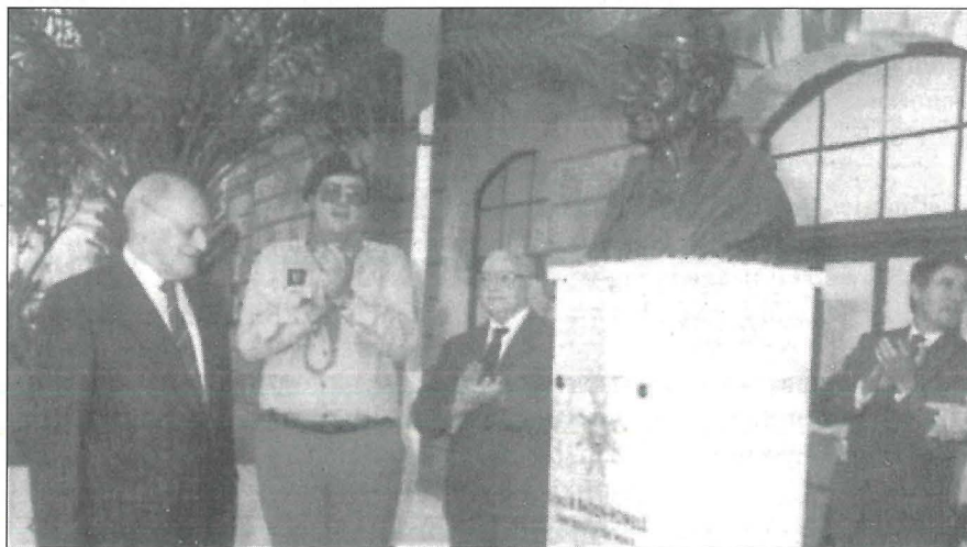
Dr Ċensu Tabone meta kien President ta' Mala, jikxef bust ta' Lord Baden-Powell barra l-bieb tal-Headquarters tas-Sliema Group f'għeluq it-80 anniversarju ta' l-istess grupp.