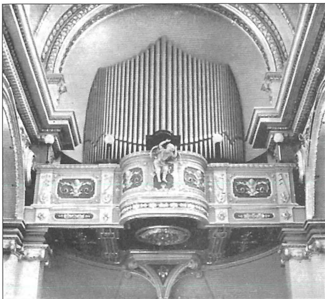
L-Orgni l-kbir li sar fl-1938 mid-ditta maghrufa Balbiani Bossi ta' Milan fl-Italja. Il-gallerija tieghu hija xoghol sabih ta' Lorenzo Rocco minn Tas-Sliema.

Cuor, taht il-mant ċelesti eleganti, li sewsew 120 sena ilu ssawret mill-idejn ta' l-istatwarju maghruf Ġilormu Damanin, dahlet issaltan fil-qlub tas-Sliemiżi f'din irroqgh ta' Tas-Sliema li hija għażlet bhala ghamara taghha għal dejjem.