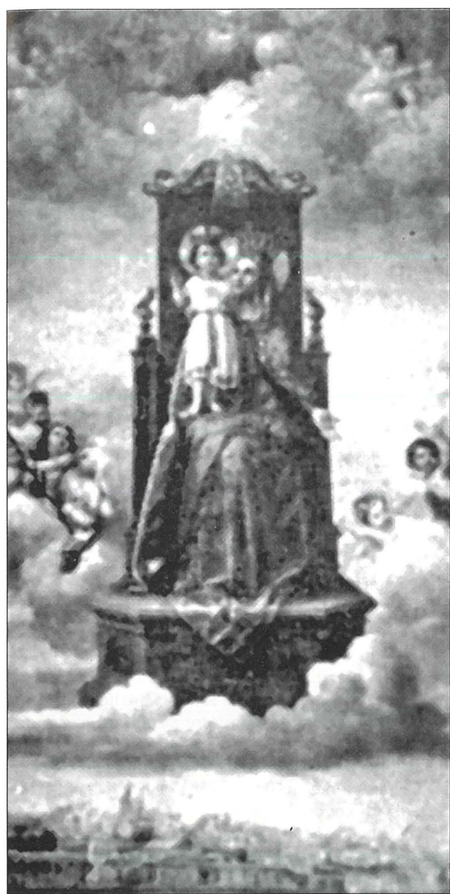
Il-Kwadru Titulari tal-Madonna tas-Sacro Cuor fil-Parroċċa taghna, b'Tas-Sliema taħtha, xoghol tas-Sorijiet Frangiskani Missjunarji ta' Marija, f'Ruma.