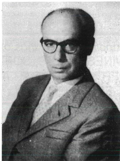
... u fl-1935.

fost il-Ġurija ta' Konkorsi dwar Kantanti u Kompożituri, waqt li sikwit kien jiġi mitlub jorganizza "Festivals", li ħafna drabi kien imexxi hu stess il-mużika tagħhom, fi bliet kbar fl-Ewropa.