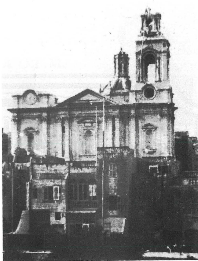
Il-Bini tal-Faċċata l-Ġdida tal-Knisja — tidher għada b'kampnar wieħed.