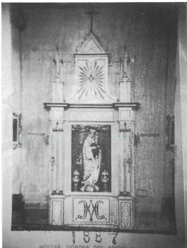
Il-Vara fin-Niċċa taghha fl-1887.