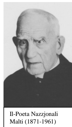
Il-Poeta Nazzjonali Malti (1871-1961)