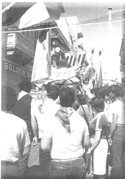
Ċelebrazzjonijiet tat-Tim tas-Sliema Wanderers f'din it-triq.