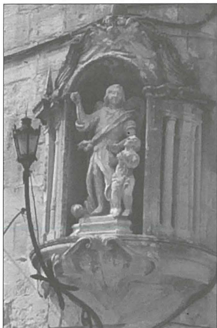
L-istatwa tal-Arkanġlu Rafel