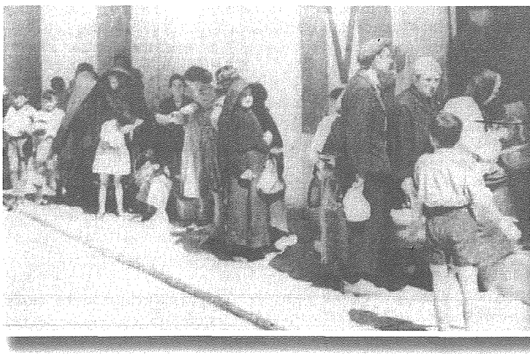
Fl-1942, f'nofsinhar Kju għar-razzjoni tal-ikel quddiem il- 'Victory Kitchen'