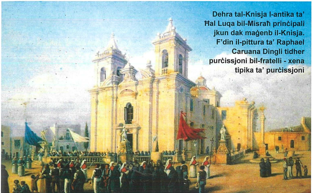
Dehra tal-Knisja l-antika ta' Hal Luqa bil-Misraħ prinċipali jkun dak maġenb il-Knisja. F'din il-pittura ta' Raphael Caruana Dingli tidher purċissjoni bil-fratelli - xena tipika ta' purċissjoni