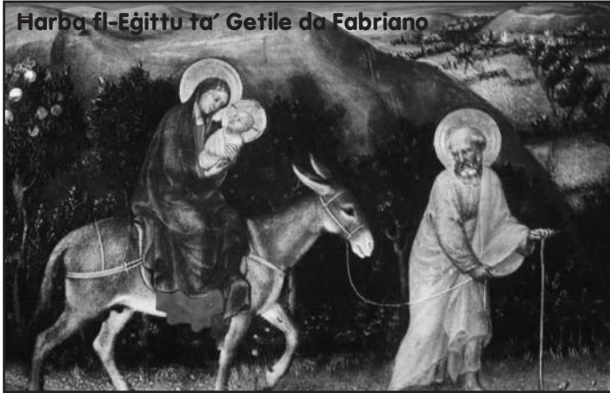
Harba fl-Eġittu ta' Getile da Fabriano

fiduċja fik. Ix-xatt li fih irrid nasal hu l-bogħod u ma nafux; imma jiena żgura li se nasal bla ma neghreq, mingħajr ma nibqa' vittma tal-mewġ tal-baħar. Se nkun imkissra mill-mewġ qalil, imma mhux se jidfinni, għax kull darba d-driegħ tiegħek se jgħini nerġa' lura fil-wiċċ tal-mewġ b'din is-sigra tal-ħajja li nżomm fi driegħi. Jiena nilqa' t-tbatija li inti tridni niprova; jiena noqgħod għat-theddida tas-sejf jaqta' li se jinfidli ruħi; ibqa' żommni, biex ma nonqosx meta nasal fil-quċċata tat-tbatijiet li int ħabbartli minn qabel. Inti ma tistax tbat; imma dan Ġesù, li hu wkoll ibnek, li hu daqsek, dan jista' jbati, u jrid ibati. X'se tiswielek it-tbatija tiegħu, it-tbatija ta' ibnek? X'misteru ta' mħabba u ta' ħniena! Min jista' jifhmek? Alla tiegħi, agħtini l-imħabba tiegħek, biex mhux biss nirrassenja ruħi għat-tbatija tiegħu, imma nagħmel dan b'att ta' mħabba bla tarf. Missier Qaddis, żomm qawwiġa l-qalb tiegħi ta' omm, biex ma nħallix waħdu lil Ġesù tiegħi fit-tbatija tiegħu, imma nkun dejjem miegħu u hekk infarrġu fl-oċċjan tat-tbatijiet tiegħu u l-faraġ tiegħu jkun ukoll l-uniku faraġ tiegħi".