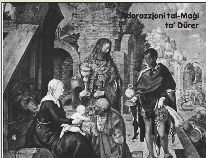
Adorazzjoni tal-Maġi ta' Dürer

"Imma min jiena jien biex nistenna twegiba mingħandek? Le, Mulej tiegħi, jiena ma nistenna l-ebda twegiba għall-mistoqsija tiegħi. Jiena noqgħod għall-verdett divin tiegħek u għalkemm jiena ninsab imdaħħla fid-dlam oħxon tal-ġudizzji tiegħek li ħadd