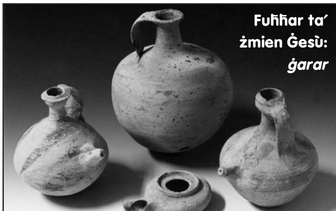
Fuħħar ta' żmien Ġesù: ġarar

igħidilhom: 'Jagħtik il-Mulej ulied minn din il-mara flok il-wieħed li inti tajt lill-Mulej'" (1 Sam 2, 20). Anke l-profeti jberku. Niftakru fis-silta bikrija ta' Balak u Balgham: "Mbagħad Balak qal lil Balgham: 'X'għamiltli! Jiena ġibtek biex tisħetli l-għedewwa tiegħi, u issa int qiegħed tberikhom!" (Num 23, 11).