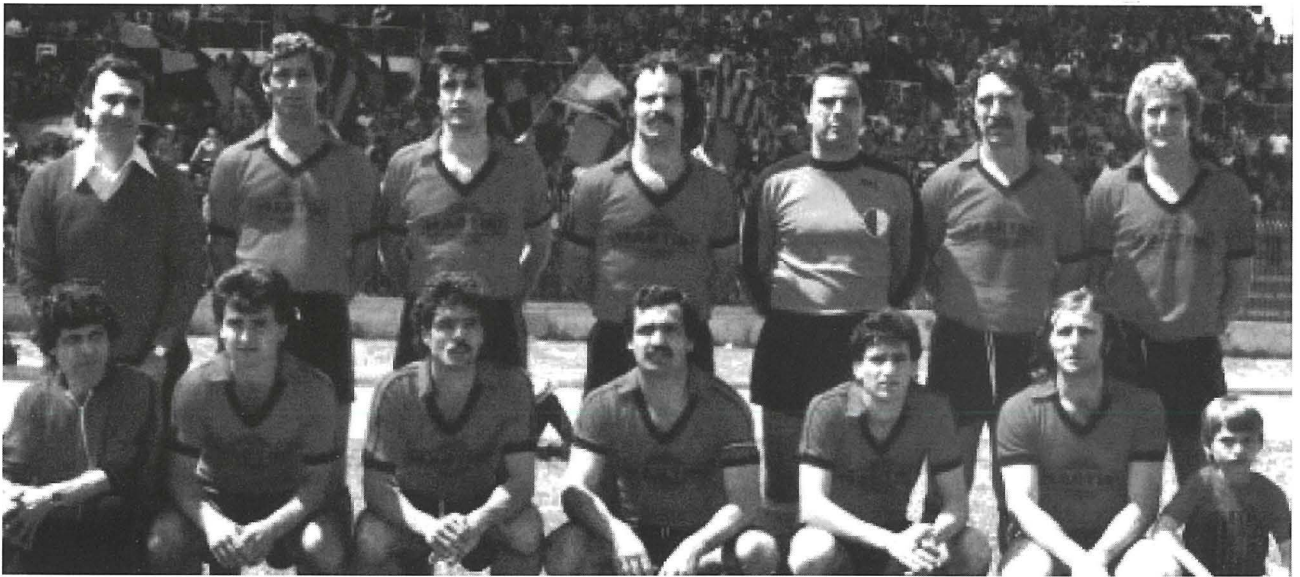
It-tim tal-Hamrun Spartans 1982-83

t'abbuż u iktar attendenza. Il-Hamrun Spartans mill-ewwel bdew bir-rebh: 2-0 kontra ż-Żurrieq, dak iż-żmien skwadra tajba li kienet qed tkompli tissahhah, fit-tielet sena taghha fil-kampjonat. Komplew b'rebhiet impressjonanti, fosthom 5-1 kontra r-Rabat, dak iż-żmien, kienu ghadhom kif telghu mal-kbar, u kellhom bosta plejers promettenti, fosthom Carmel Busuttil, li dak iż-żmien kien ghadu żaghżugh ta' 18-il sena. Kien hemm rebha importanti kontra s-Sliema li kienu jidhru li setghu jaghtu sfida ghall-kampjonat, ghallinqas fl-ewwel rawnd. Il-Hamrun tilfu biss żewġ punti fl-ewwel rawnd, meta qasqu l-punti mal-Belt u l-Furjana. Imma kellhom tliet punti vantaġġ fuq l-eqreb skwadra, is-Sliema Wanderers. Fin-naħa t'isfel, Haż-Żebbuġ kienu ankrati b'punt wiehed biss, imma l-Belt, il-Furjana u l-Hibs kienu fil-periklu b'hamsa u sitt punti rispettivament.