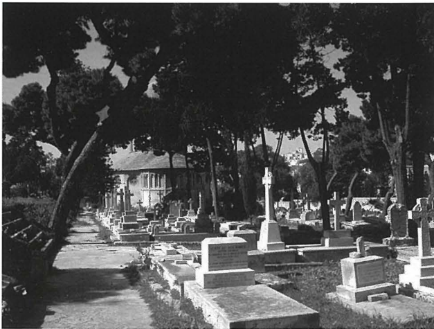
Iċ-Ċimiterju ta' Braxia.