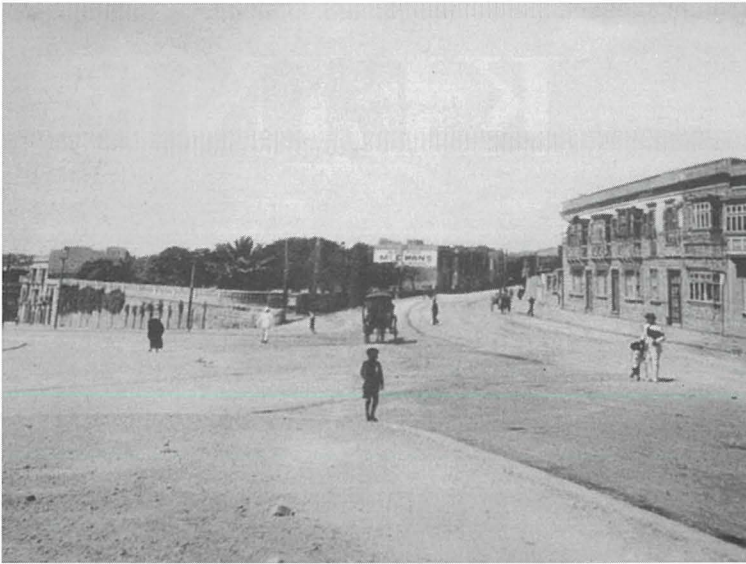
Iċ-ċimiterju fi Blata l-Bajda fejn illum insibu d-dar ewlenija tal-Museum.