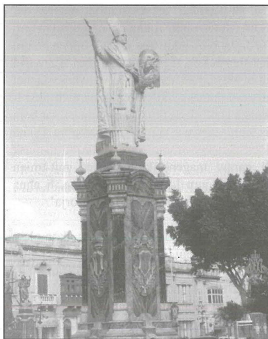
Il-pedistall ta' l-istatwa tal-Papa Piju XII armata fil-Pjazza tal-Mosta

J. Borg 'Il-Pulpu li għandna fil-Knisja Arċipretali', Filarmonika Santa Marija, Annwal 1997 .