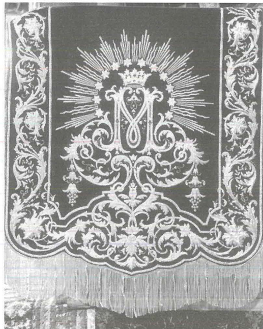
It-terħa l-prima tal-bellus li tintrama fuq l-artal magġur għall-festa ta' Santa Marija

Għaldaqstant kull meta gie mqabbad, ħadem għal qalbu biex ir-Rotunda jsirulha opri sbieħ u artistici li tassew jixirquha. Nistgħu ngħidu li barra mir-Rabat u mill-Mosta, għadd sabiħ ta' opri oħra tiegħu jinsabu mxerrdin l-aktar f'numru ta' knejjes u ta' każini tal-banda li għandna f'Malta.