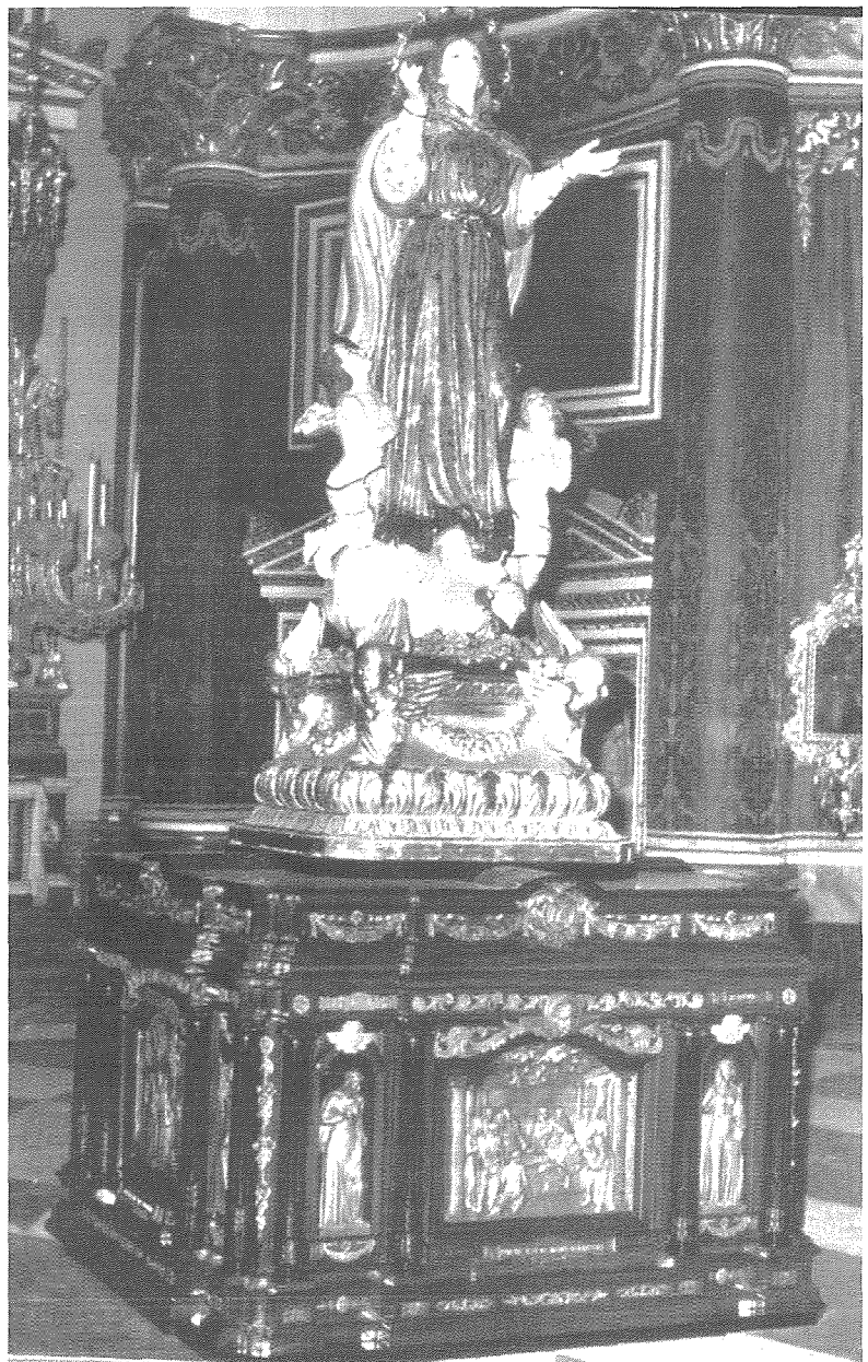
Deħra tal-bankun artistiku bl-istatwa ta' l-Assunta armata fuqu; fuq ix-xellug tidher linfa b'wieħed mill-fjokkijiet; fuq il-lemin jidher wieħed mill-ornamenti ta' fuq id-damask

L-ikbar opra ta' Tonna li ħadem għall-knisja tagħna kien il-bankun artistiku ta' l-Assunta li iżżanzan b'sodisfazzjon kbir tal-poplu Mosti fl-1957. Għal din il-biċċa xogħol hekk sabiħa huwa kien meġħjun minn zewġ mastrudaxxi