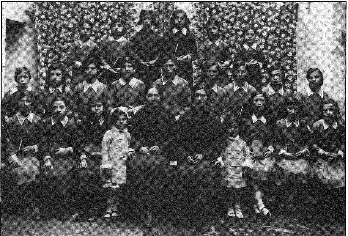
Grupp ta' xebbiet li gawdew mit-tagħlim tas-Sorijiet fis-snin tletin (1937)

Kitba u esperjenzi personali ta' l-awtur.