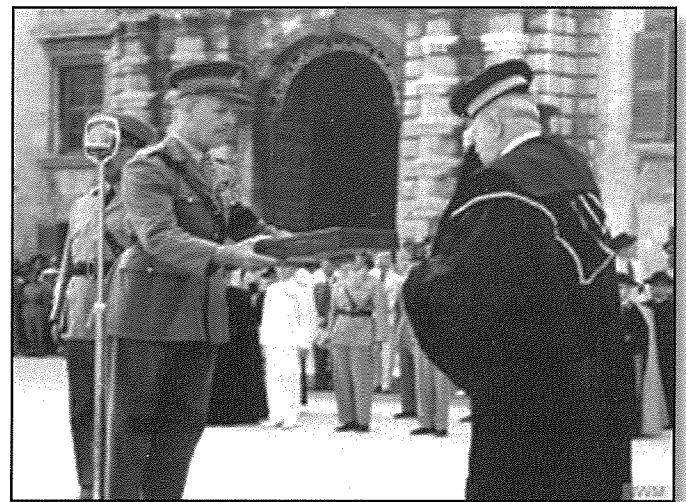
L-għotja tal-George Cross lill-Maltin għal-qlubija lill-Maltin urew waqt il-gwerra

Bejn l-1940 u l-1944 kien hemm 17- il konvoj bid-destinazzjoni tagħhom tkun Malta. Uħud minnhom waslu, oħrajn le, iżda l-aktar li jibqa' minqux fl-istorja tagħna huwa dak ta' Santa Marija, u ħafna emmnu li l-fidi u t-talb lill-Madonna kien mismugh propju fil-festa tagħha, meta Malta kienet f'salib it-toroq bejn li ċċedi jew tibqa' fuq saqajha. L-istorja tat raġun lid-determinazzjoni ta' Malta. Tant kemm hu hekk li x-xahar ta' wara fit-13 ta' Settembru, Malta giet ipprezentata formalment bil-George Cross għall-