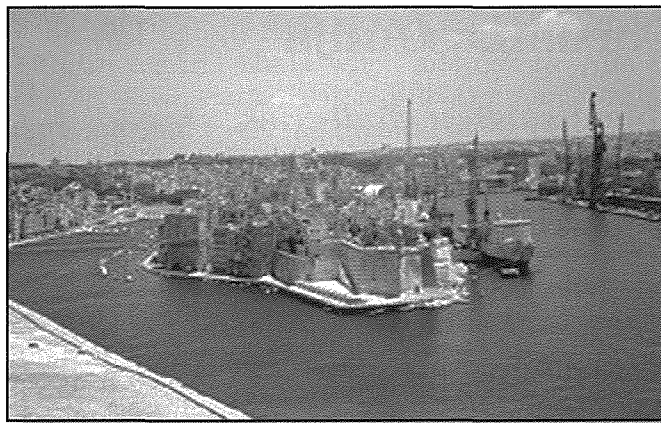
It-tarzna u l-Port l-Kbir

Il-gzejjer Maltin fi żmien l-Ingliżi kellhom ekonomija ta' fortizza ( fortress economy ) jiġifieri ekonomija li kienet totalment tiddependi fuq in-nefqa li l-Ingliżi kienu jagħmlu f'Malta. Hafna drabi, din in-nefqa kienet tizdied sostanzjalment fi żmien ta' gwerer; għalhekk il-gzejjer Maltin kienu jmorru ekonomikament tajjeb fi żmien ta' gwerer għax kienu jizdiedu l-impjegji fit-tarzna biex tintlaħaq id-domanda tas-servizzi navali. Il-portijiet ta'Malta flimkien mat-tarzna kienu