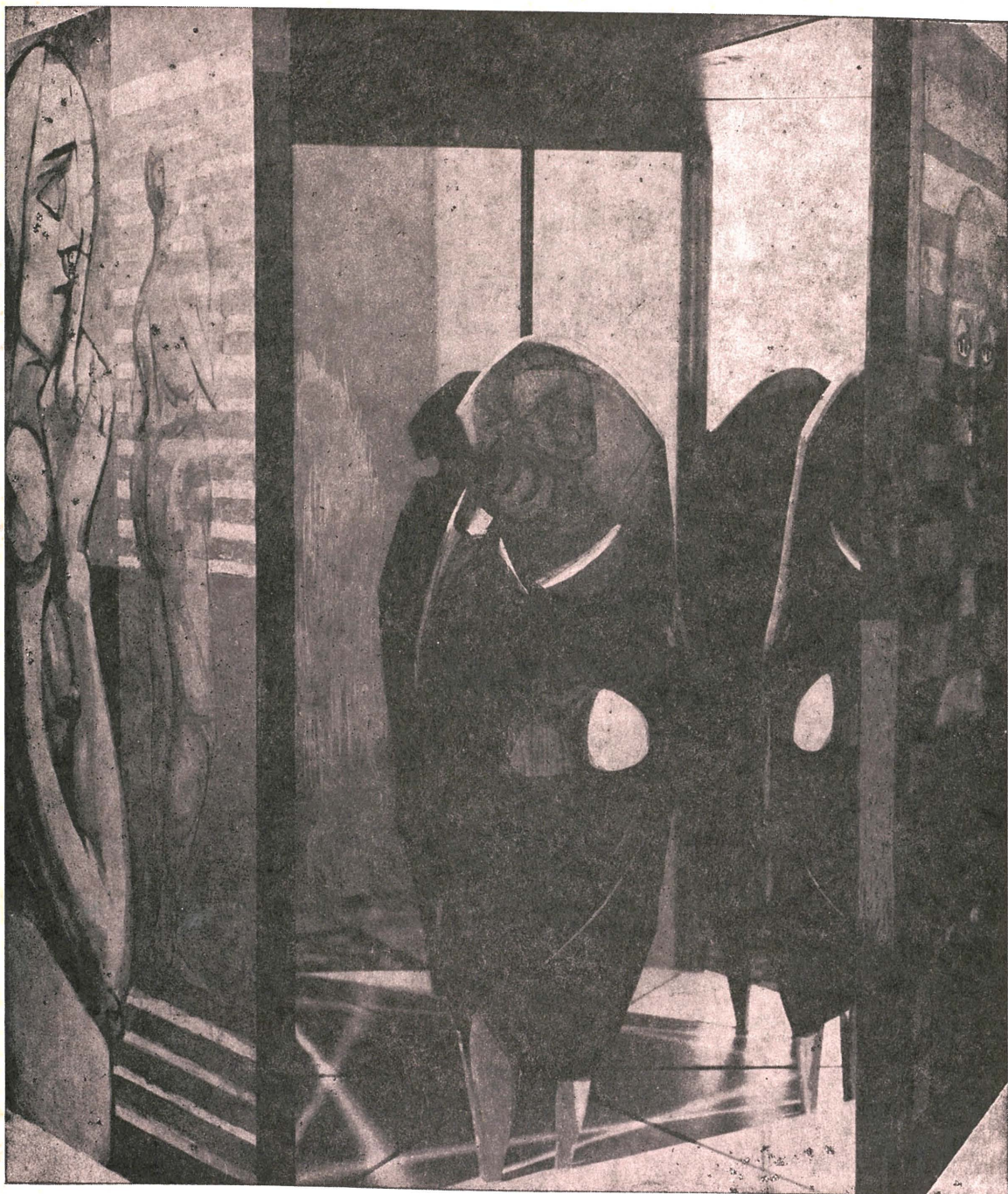
GOSSIPERS (Wood and Mirror)