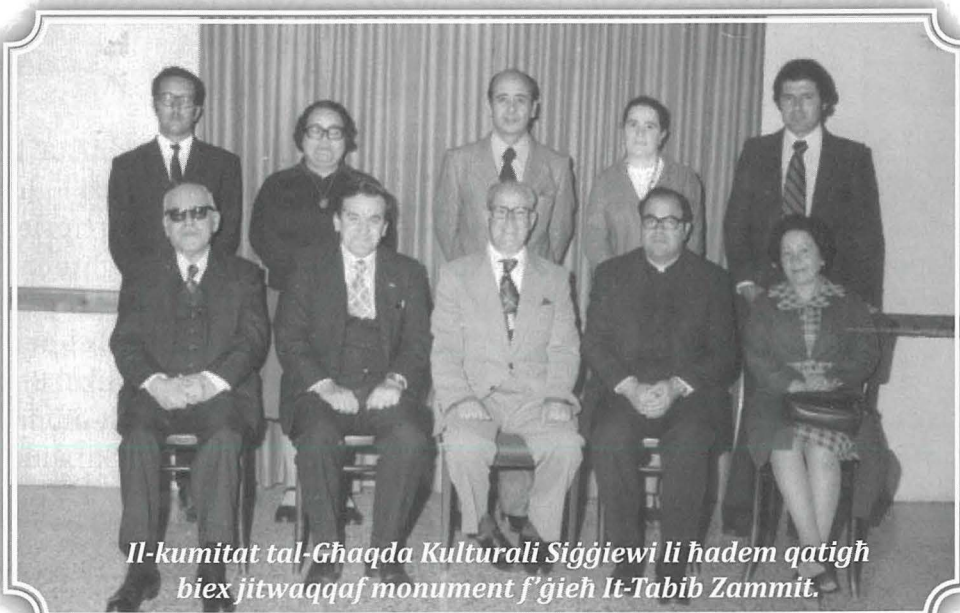
Il-kumitat tal-Għaqda Kulturali Sigġiewi li hadem qatigh biex jitwaqqaf monument f'għieh It-Tabib Zammit.