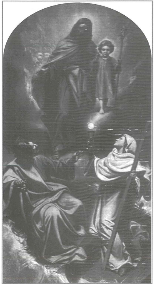
Kwadru titulari fil-knisja parrokkjali tal-Kalkara