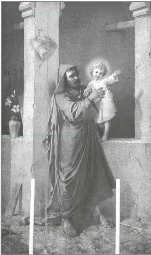
Kwadru tal-artal ta' San Ġużepp fil-knisja ta' San Gejtanu fil-Ħamrun

Huwa fatt magħruf sew li f'bosta mill-knejjes f'Malta u Għawdex insibu għadd kbir ta' xogħlijiet tal-artist magħruf Ġużeppi Cali. Is-sugġetti ta' dawn ix-xogħlijiet huma ħafna u minnhom joħorgu fid-deher il-kapaċitajiet artistici kbar li kellu dan l-artist li għex bejn l-1846 u l-1930.