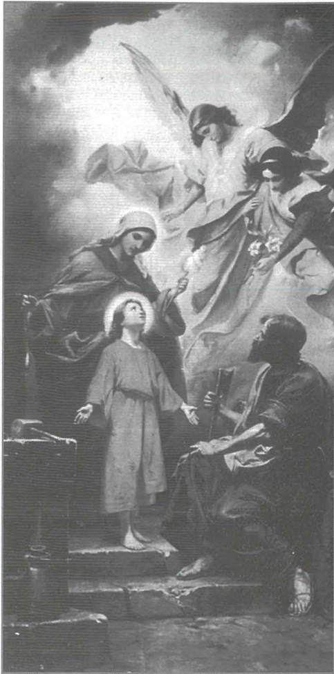
Kwadru tas-Sagra Familja fil-Knisja tar-Ragħaj it-Tajjeb f'Hal Balzan